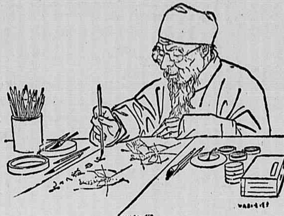
Auto-retrato de Ichi-Pai-She, o famoso pintor chinês, mestre das novas gerações

Aproveite e recomende a nossa seção de pequenos anúncios a Cr$ 10,00 por vez, em dois centímetros por coluna