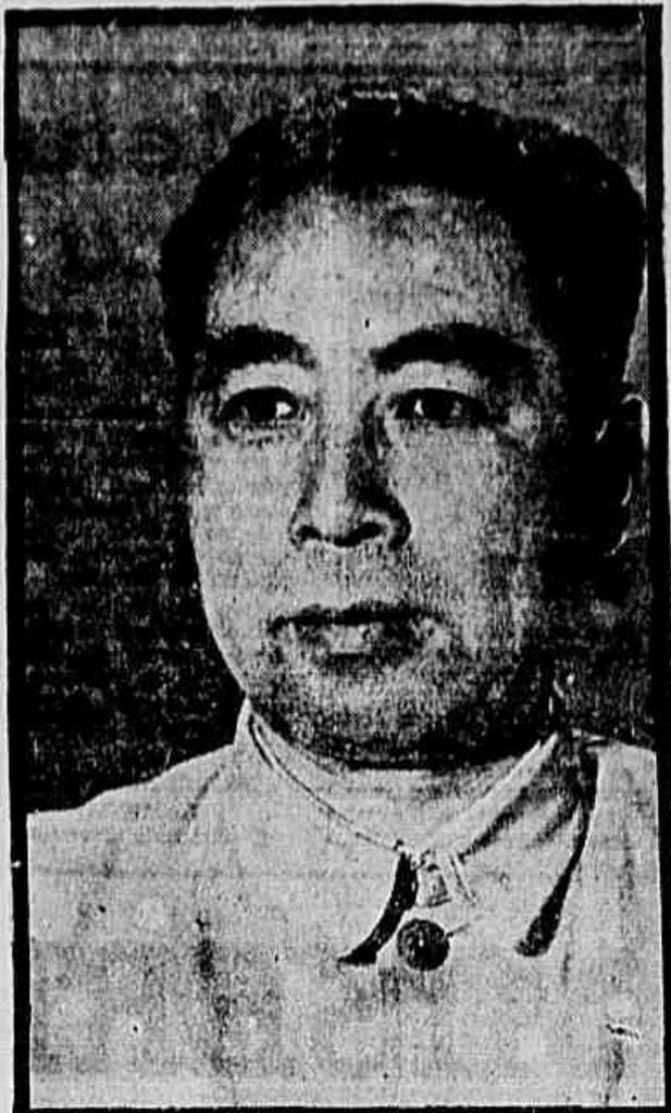
CHU EN LAI

O Sr. Chu En Lai lembra que a China frequentemente protestou junto às Nações