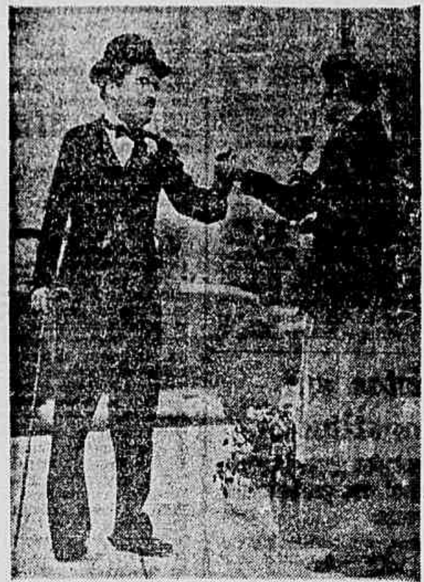
Hollywood banu a comédia. E o grande Chaplin, que ali criou obras de arte como "Luzes da Cidade" (no clichê) foi expulso do país pelo neocartismo. A verdade da vida não mais é permitida nos filmes norte-americanos