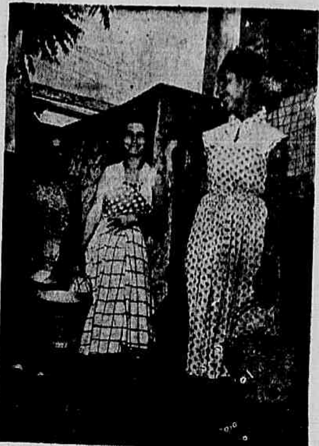
Em Cachambi, apenas nos reservatórios de algumas obras em construção é possível a obtenção de água. — «Isto quando o fiscal da obra está de bom humor», dizem os moradores