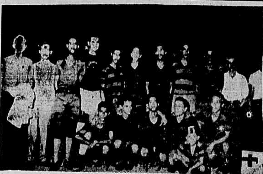
VAI A S. PAULO O CURUPAITI — Na peleja finalíssima do campeonato futebolístico patrocinado pela Federação da Juventude Democrática, realizada na noite de domingo do Centro F. C., o conjunto do Curupaiti F. C. venceu por 4 a 2 o time do S. C. Comerciantes, levantando, brilhantemente, o título de campeão. (Na foto o quadro campeão, que candidatou-se a uma viagem a S. Paulo a fim de participar dos festejos que serão realizados por ocasião do Festival da Juventude Sul-Americana.