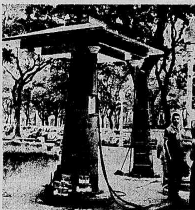
Ainda não chegou à COFAP o processo de aumento da gasolina. Mas o aumento é certo, em face dos novos ágios fixados pelo Ministério da Fazenda. A Standard Oil levará de lucros, com a história, cerca de 600 milhões

Enquanto permanece em sigilo o paradeiro do processo de aumento dos preços da gasolina, o Conselho da Superintendência da Moeda e do Crédito, em sua última reunião, voltou a tratar da questão da importação de petróleo e derivados, tudo fazendo crer que será alterado o regime atual do leilão de ágios. Já ontem não se realizou o leilão simbólico de divisas para a compra de combustíveis.