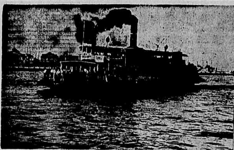
Provavelmente não será interrompido o tráfego de lanchas entre o Rio e Niterói. Está aguardando para hoje o pagamento dos marítimos das duas empresas