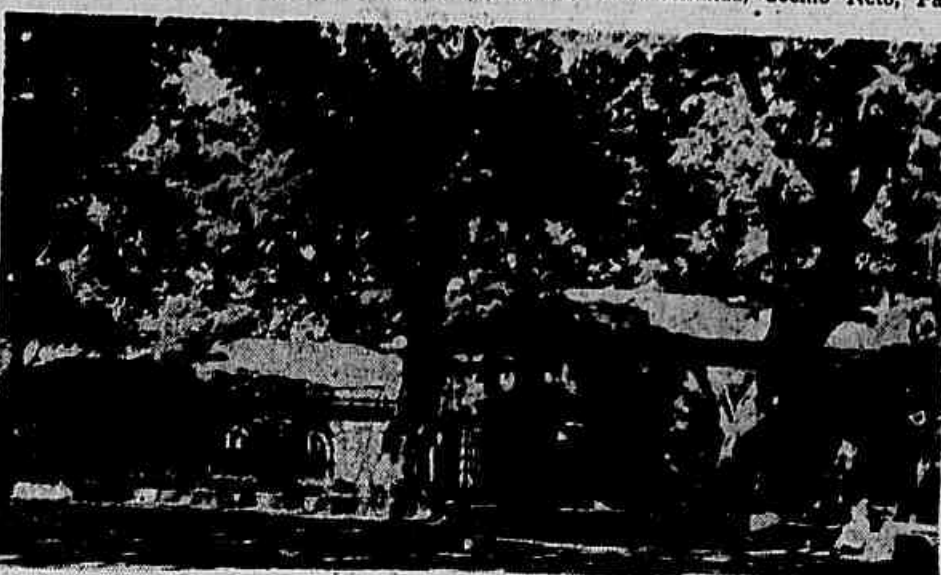
O jardim de infância que se vê no clichê está localizado no Campo de Santana, Praça da República. Não existem muitos como este na Capital da República; em compensação o número de menores abandonados sobe a várias dezenas de milhares

poucos jardins de infância que tem no centro da cidade