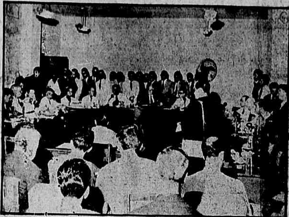
FLAGRANTE da mais agitada das reuniões já realizadas na COFAP. Seguidamente, a assistência, composta de dirigentes de organizações da indústria, comércio, lavratura e sindicatos operários interrompe as palavras dos conselheiros, aplaudindo entusiasticamente as que anteciparam seu voto contra o aumento da gasolina.