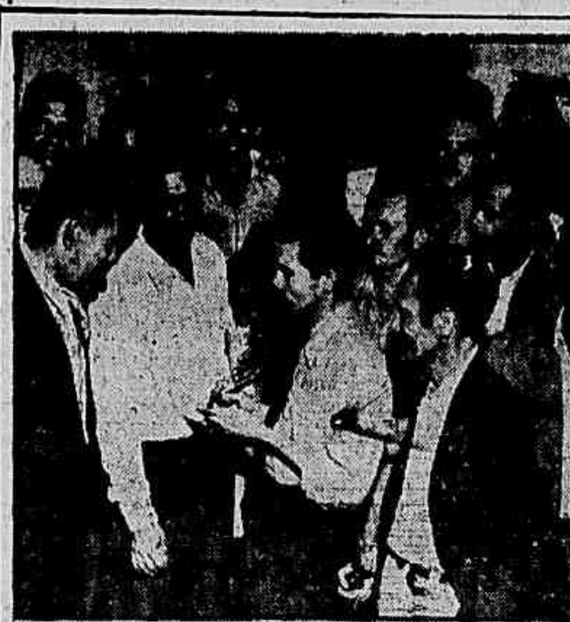
Logo depois da reunião no Sindicato, numerosos comissão de metalúrgicos visitou a nossa redação

ESPANTOSAS CONSEQUÊNCIAS A posição dos conselheiros da COFAP do General Pantaleão Pessoa, foi determinada pelo voto de CONCLUI NA 2ª PAG.