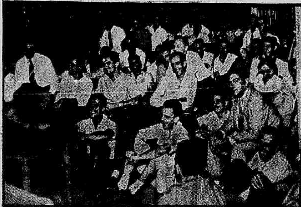
Fragrante da assembleia de ontem dos pilotos da Panair

OS BANCARIOS reunidos ontem na sede do Sindicato, decidiram convocar uma assembleia-manifestação para o dia 14 do corrente, quando apreciarão a resposta dos patrões ao aumento de salários, que reivindicam. No fragmento acima, um aspecto da reunião, da qual damos notícia completa na segunda página.