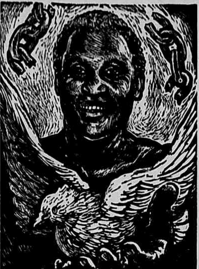
PAUL ROBSON, gravura do estre mexicano Leopoldo Mendez. O grande artista negro norte-americano, prisioneiro do fascismo italiano, teve de reclamar, uma vez mais, a defesa de seus advogados, o direito de transferir residência para o México ou o Canadá.

«... A guerra da Coreia e a mobilização nacional combinaram-se para privar as escolas de considerável apoio... vários Estados e comunicações locais diminuíram suas despesas escolares no terreno em que «economia» deve ser aplicada e todos os planos que não sejam de defesa...» «Isto quer dizer que menos dinheiro está sendo gasto em educação, relativamente, do que há 10 anos passados...»