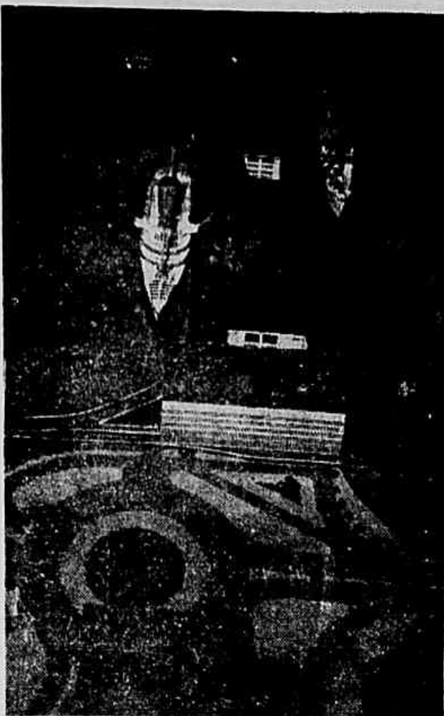
Aqui está a reprodução da maquete do pier da Praça Mauá, tal como foi projetado, há alguns anos...