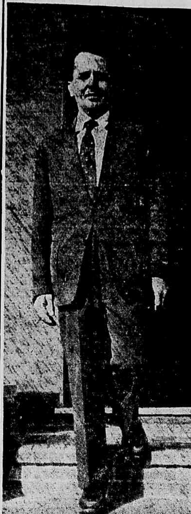
LUIZ CARLOS PRESTES, Secretário-Geral do P.C.B.

Empunhando com firmeza a bandeira da paz e da libertação nacional, o Partido Comunista do Brasil é, hoje, a esperança de milhões de trabalhadores e de todos os patriotas