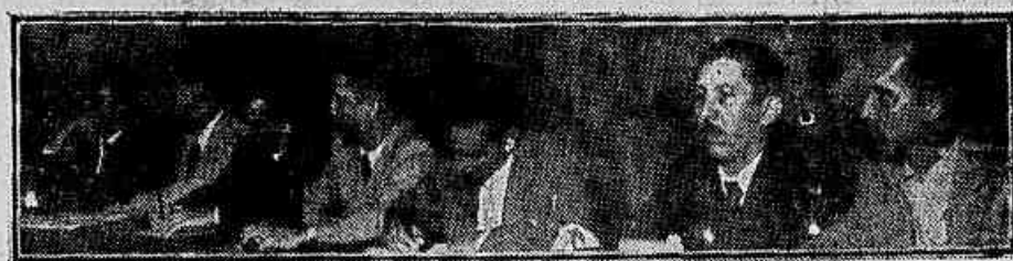
No clichê acima um aspecto parcial do Teatro João Caetano, superlotado na noite de ontem pelos bancários cariocas. Em baixo, a mesa que presidiu os trabalhos

Ameaças como a do «New York Times» — que em vez de força revelam insegurança e desespero — indicam que o caminho da unidade para a vitória de um candidato patriota é o caminho justo, e o único verdadeiro, que deve ser trilhado na campanha sucessória por todos os brasileiros e por todas as forças políticas dispostas a defender a soberania nacional e a preservar a honra da Pátria.