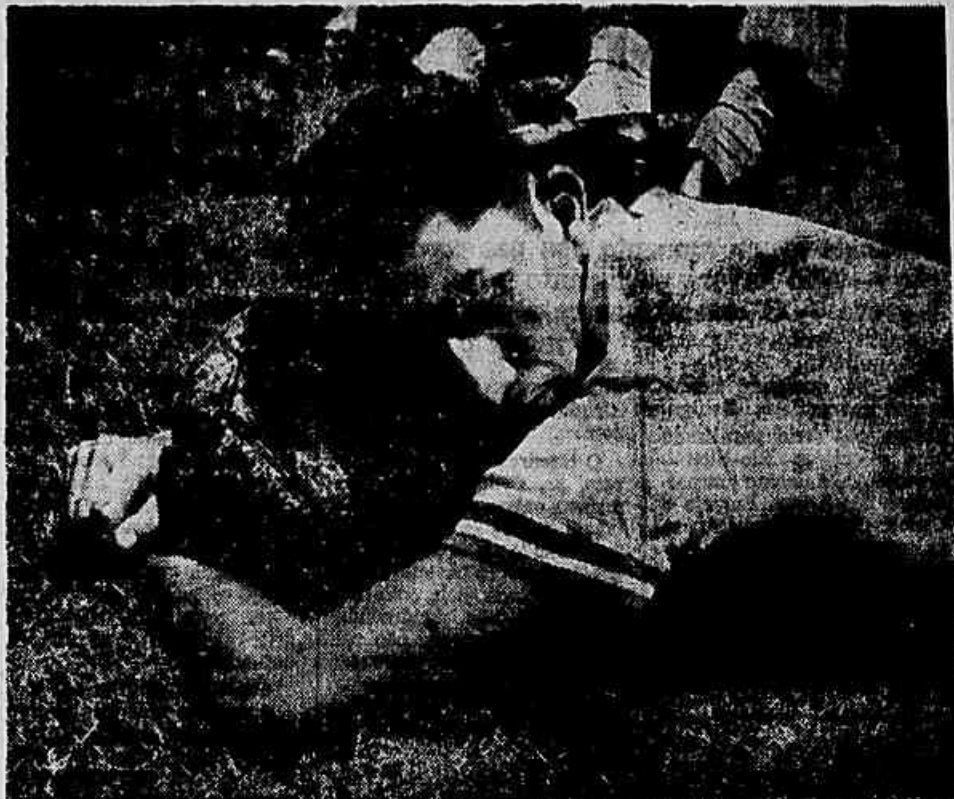
Parodi, autor de um gol

Olaria, 2 x Combinado Olímpico-Irati, 0. Ponte Preta, de Campinas, 4 x Fortaleza, do Ceará, 0.