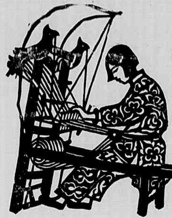
Papel-colado do artista chinês Chian Feng

RESPONDAMOS a uma consulta do leitor A. L. sobre os quatro pontos a que nos referimos quando divulgamos uma notícia sobre a recente exposição de artes aplicadas chinesas na Techeostoviqua: