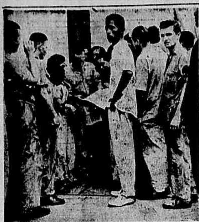
Operários da Metalgráfica Brasileira quando iam, na porta da fábrica, a IMPRENSA POPULAR