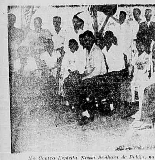
No Centro Espírita Nossa Senhora de Belém, no Distrito de Eden, em São João do Meriti, realizou-se um ato promovido pelo Distrito Municipal da Liga de Emancipação Nacional, visando a fundação do Núcleo local e a escolha dos delegados que participarão do Congresso Nacional de Defesa do Petróleo. No clichê um aspecto da reunião.