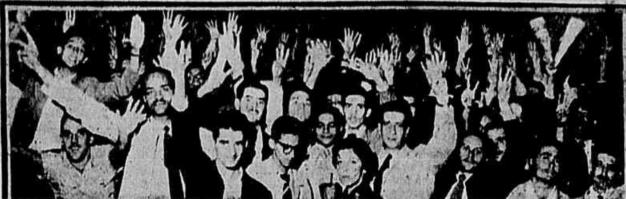
"Nada menos que os 35% o o mínimo de Cr$ 1.200,00" afirmaram em nossa redação algumas centenas de bancários, na noite de ontem

Os maiores do PSD, articuladores da candidatura do entreguista Juscelino Kubitschek, teriam conseguido explorar em seu benefício os frutos da situação. E tratam de imprimir à manobra um sentido objetivo, tentando negociar o apoio das altas esferas do P.T.B. para as hostes do ex-governador de Minas Gerais. A isca seria a inclusão do nome (CONCLUI NA 4ª PAG.)