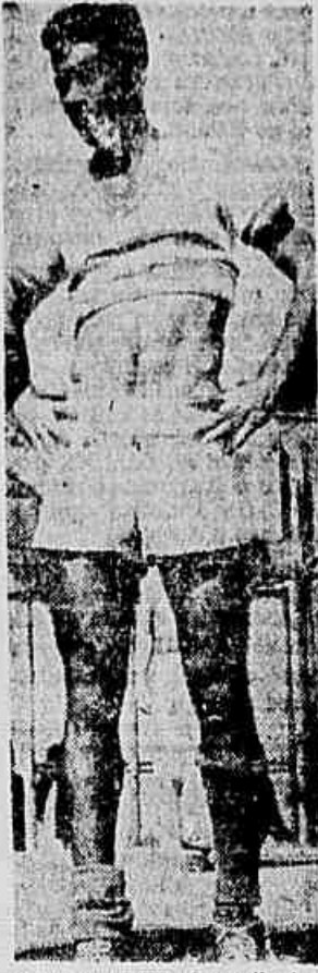
Santos, o "professor" do quadro alvinegro

RUA MINISTRO MENDONÇA LIMA, 714 Nova Iguaçu Estado do Rio