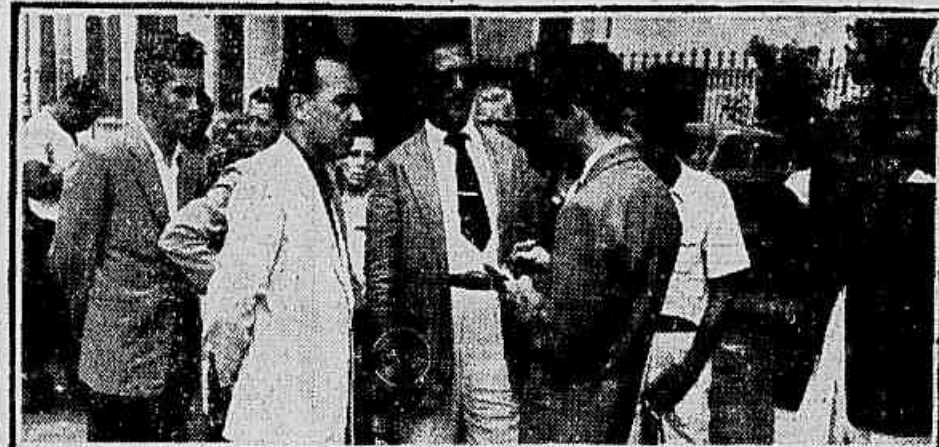
Passageiros nas filas de ônibus criticam duramente o novo plano de tráfego

RESOLVE O AMÉRICA NEGOCIAR OSVALDINHO (Texto na 2ª pag.)