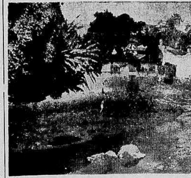
Era, outrora um belo rio que servia à cidade. Hoje, reduz-se a um atoleiro carregado de lixo, lama, restos de esgoto, ameaçando a cidade

Água estagnada, inundação, bichos no rio, detritos de es-