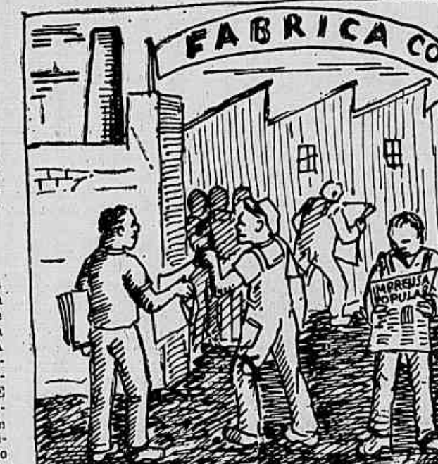
Apesar de a fábrica onde você trabalha, leve alguns exemplares da IMPRENSA POPULAR para seus colegas. Assim, caro leitor, além de estar contribuindo para o aumento de nossa difusão, você estará concorrendo a valiosos prêmios instituídos pela ACAID

Uma delas era o comando individual. Você pode, sem