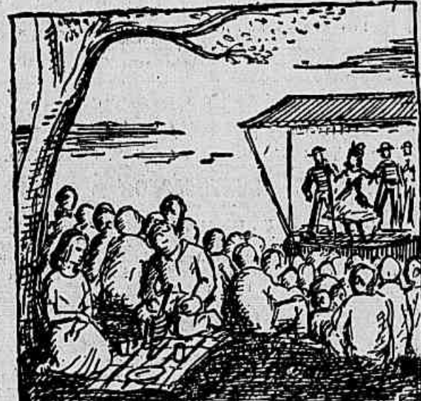
Aproxima-se o dia 24 e com ele a grande festa que a ACAID fará realizar na tradicional Granja das Carças, em Campo Grande. Entre outras coisas, fazem parte da programação da festa um magnífico espetáculo teatral, do qual participam conhecidos artistas dos palcos cariocas e um succulento churrasco a galinha, preparado por especialistas no assunto

No próximo sábado será realizado em Niterói uma reunião de correspondentes da IMPRENSA POPULAR. Essa reunião terá lugar na sede de nossa sucursal na vizinha capital, a Rua Viscondessa de Uruguai, 464, sala 102, às 20 horas e a ela deverão comparecer todos os trabalhadores e amigos da IMPRENSA POPULAR no Estado do Rio de Janeiro, como correspondente de notícias de empresas ou bairros.