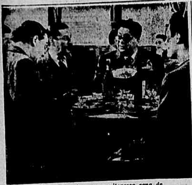
Aldo Fabrizzi em uma pitoresca cena de "Paris é Sempre Paris"