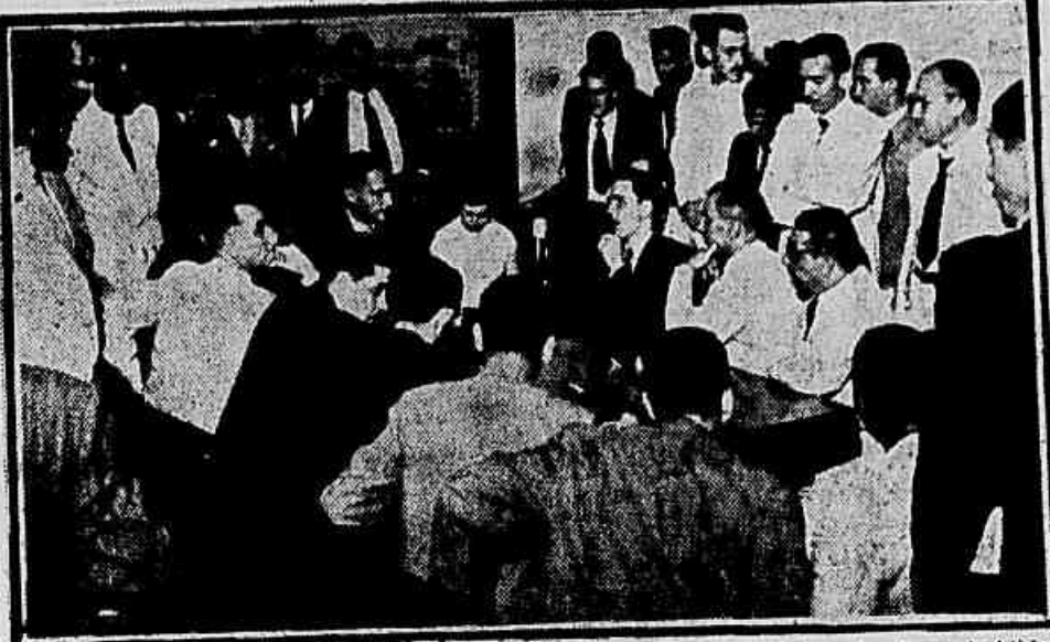
A reunião de ontem no Departamento Nacional do Trabalho, onde nada ficou decidido para solucionar a reivindicação dos trabalhadores

Espera-se que aqueles parlamentares denunciem à tribuna as irregularidades verificadas na Casa de Detenção de Niterói.