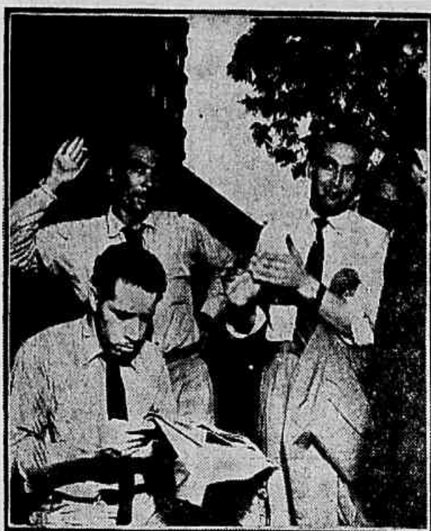
"Nada temos que ver com o aumento", dizem os motoristas ao repórter