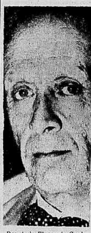
Deputado Flores da Cunha