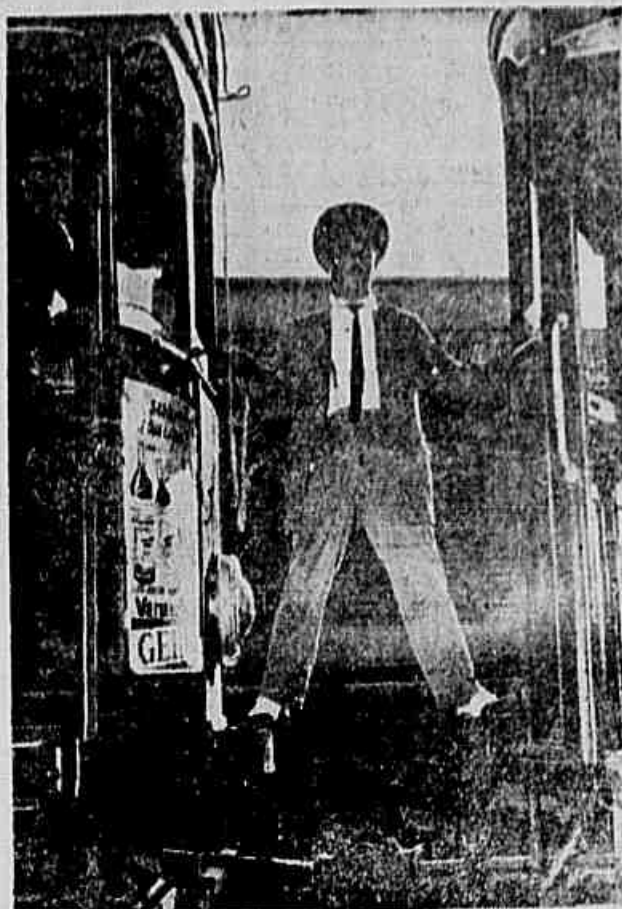
Assim trabalham os condutores nos bondes de Santa Teresa. É impossível que não ocorra um «acidente». Mas a Light recusa colocar um condutor em cada carro, pois não quer diminuir seus lucros

Não se trata, portanto, de acidente. Onde existe causa surge o efeito. Enquanto per- durar na Ferro Caril Carioca o regime de cobrança de dois carros por um mesmo condutor, os acidentes desse tipo não terão um ponto fi- nal. O mesmo ocorre em re- lação aos fiscais, que fazem a marcação dos dois carros, pendurados em um «ponto estratégico»: o engate entre o reboque e o motor. O me- nor escorregão ou desequilí- brio pode significar morte.