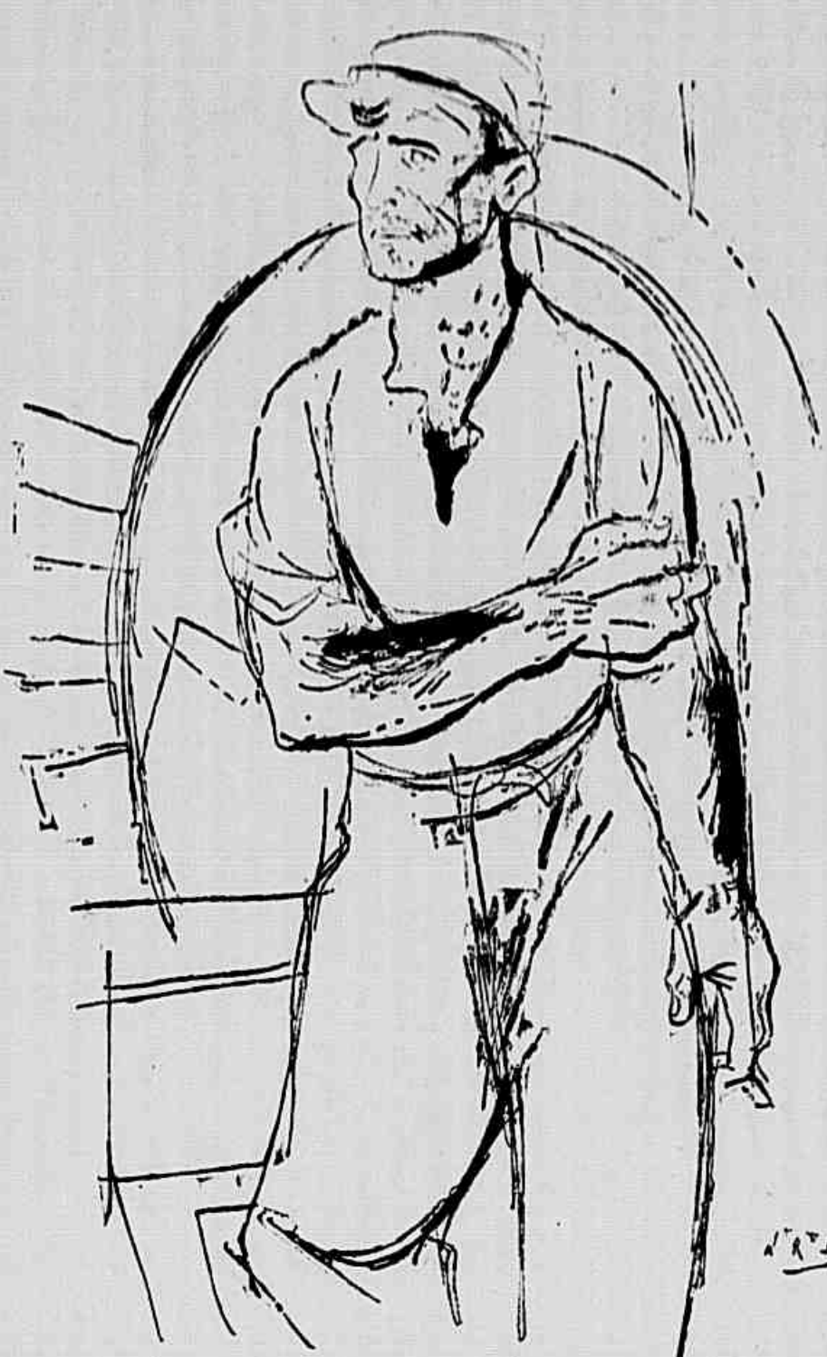
TRABALHADOR — Desenho de Newton Rezende