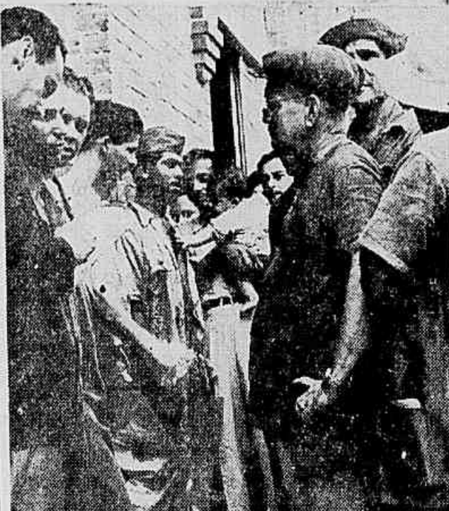
Trabalhadores do Moinho Fluminense, no intervalo do almoço, lutando à nossa reportagem

proposto é de Cr$ 0,50 nas linhas de até 10 quilômetros e de 1 cruzeiro nas linhas que ultrapassem este limite.