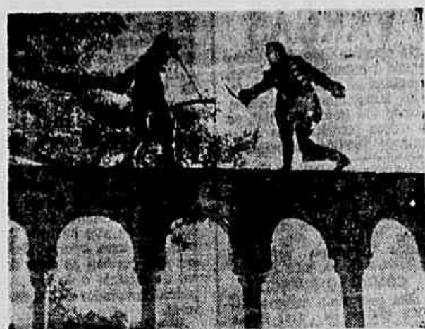
Cena do filme "Fanfan a Tulipa", cartaz da semana