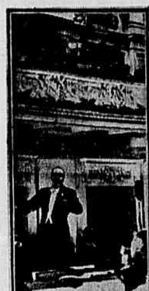
Cláudio Santoro regendo a Orquestra Sinfônica do Estado, em Moscou

que se prolongou por todo o mês de março, o compositor Cláudio Santoro teve oportunidade de apresentar ao público da capital, na grande sala do Conservatório de Moscou, regendo a Orquestra Sinfônica do Estado, peças da música brasileira contemporânea, devidas aos compositores Mozart Camargo Guarnieri e Heitor Villa-Lobos e a "Sinfonia n.º 4", também chamada "Sinfonia da Paz", do próprio Cláudio Santoro. O local escolhido — a maior sala de espetáculos musicais sinfônicos de Moscou — e a grande or-