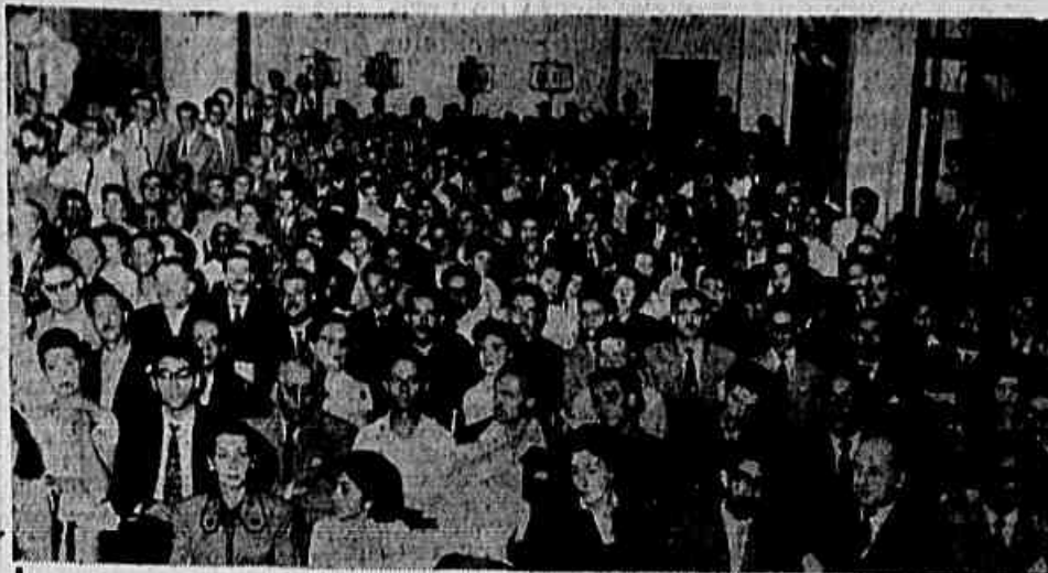
Aspecto da grande assistência, à noite da ontem, na A.B.I., na sessão solene de instalação da Assembléia Nacional das Fôrças Pacíficas

ANO VIII ★ RIO DE JANEIRO, QUARTA-FEIRA, 4 DE MAIO DE 1955 ★ Nº 1.492