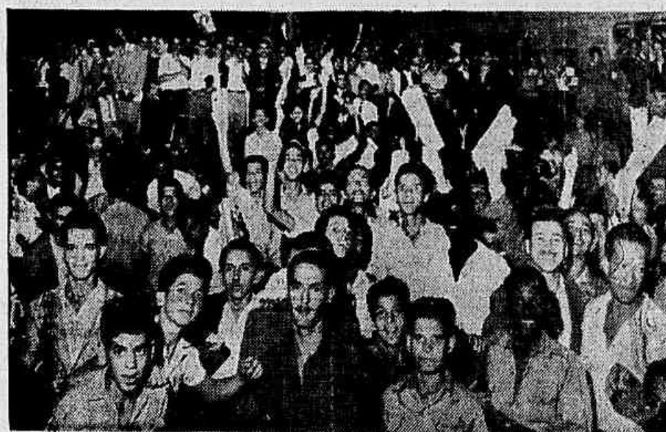
Bradando por vingança, pela punição dos assassinos, o povo enfrentou a polícia

A multidão reagiu ao atraso dos trens e aos espancamentos dos trabalhadores — O governo mandou tirotear — Soldados do Exército e da Aeronáutica solidários com a manifestação de revolta — Morto um popular — Feridos