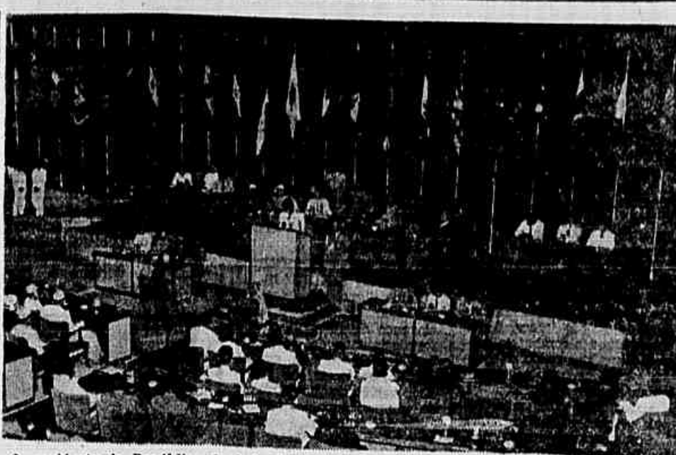
O presidente da República da Indonésia, Sukarno, pronunciando o discurso inaugural da Conferência Afro-Asiática