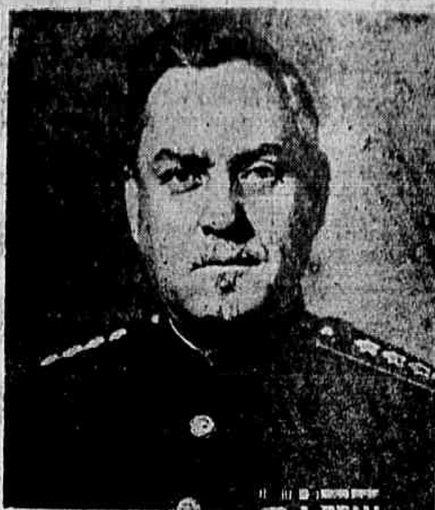
O marechal N. Bulganin, presidente do Conselho de Ministros da União Soviética assinou em nome da U.R.S.S. o histórico Tratado de Amizade, Cooperação e Assistência Mútua que estabelece as medidas práticas para enfrentar a ameaça de agressão na Europa e fortalecer a segurança coletiva dos países socialistas. A monolítica solidez e unidade dos países socialistas dão ao mundo mais uma prova de firmeza na defesa da paz.

navios sejam inscritas, num acôrdo a ser firmado com o Brasil, cláusulas que representariam a liquidação pura e simples da nossa empresa oficial de navegação. Os navios comprados pelo Brasil só seriam empregados exclusivamente no tráfego de cabotagem (Pôrto Alegre-Ma- (CONCLUI NA 2ª PAG.)