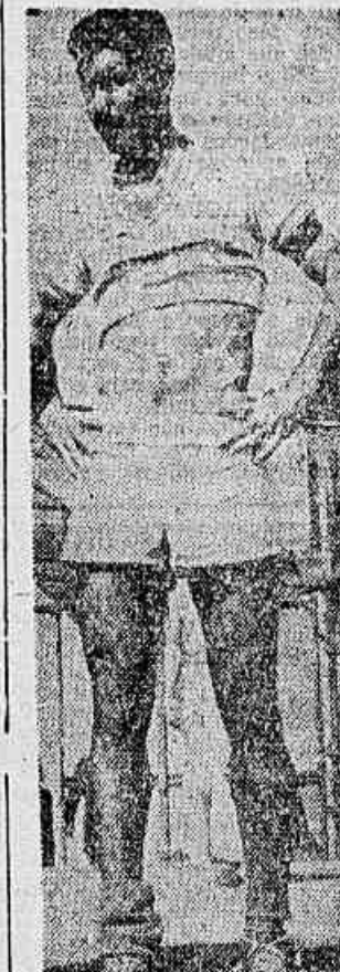
Santos, grande valor do quadro do Botafogo

A equipe botafoguense enfrentará o Atlético de Madrid com a mesma formação da peleja de estréia. Jogará, portanto, assim constituída: