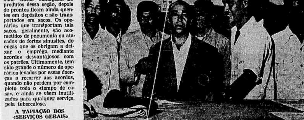
Operários do Moinho Fluminense quando faziam a reclamação no Sindicato

A TAPIAÇÃO DOS «SERVIÇOS GERAIS» Ao admitir um operário a direção do Moinho Fluminense costuma anotar vagamente que o trabalhador foi contratado para «Serviços Gerais» embora vá desempenhar tarefas específicas dentro da fábrica. Baseada naquela anotação na Carteira Profissional do trabalhador, a direção da empresa, vem agora procurando «econômizar», evitando admitir novos empregados em substituição aos que se estão afastando por doença. Assim, vem tentando obrigá-los a trabalhar nas demais seções