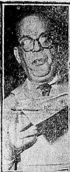
Senador Caiado de Castro

A frente única da capital paulista deve ser feita para todo o Brasil — Possível uma nova atitude do P.T.B. — Por um candidato próprio da coalizão popular