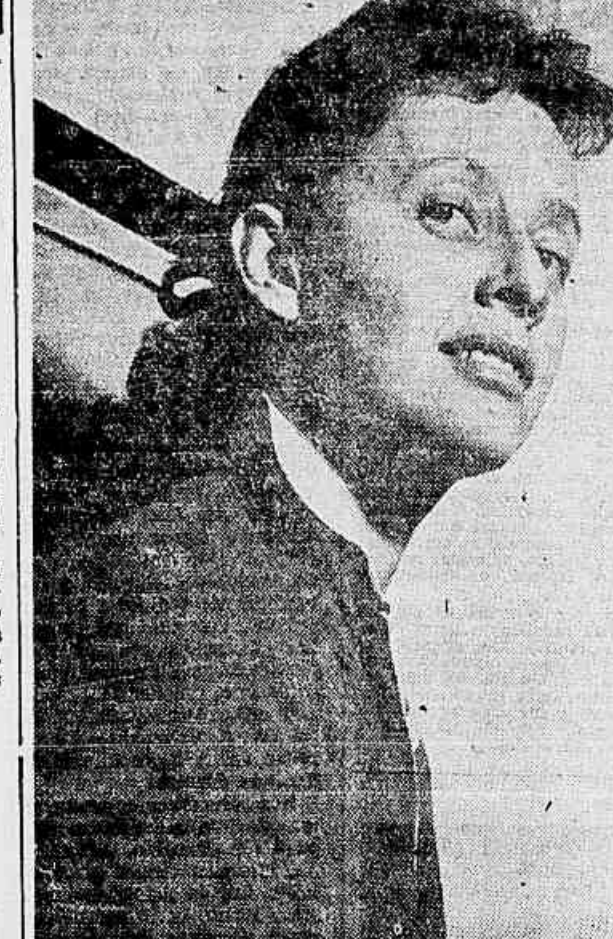
Maria Clara Machado, diretora de «O Tablado» que apre-senta no Patronato Gávea (Av. Lindeu do Paula Machado, 795) a comédia-baile «Baile dos Ladrões», de Jean Anouilh.