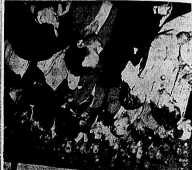
TABELA DE 50% APROVARAM ONTEM OS SAPATEIROS

Realizaram ontem movimentada assembleia os sapateiros desta capital. A assembleia teve o caráter de preparação de campanha que vão iniciar por aumento de salários. Ficou decidido realizar nova assembleia entre os dias 17 e 19 de junho, período em que expira o prazo do último acordo firmado com os patrões. A tabela aprovada pela assembleia é a que pleiteia um aumento de 50%. No clichê, um aspecto da assembleia. (Leia outras notas na 2ª página).