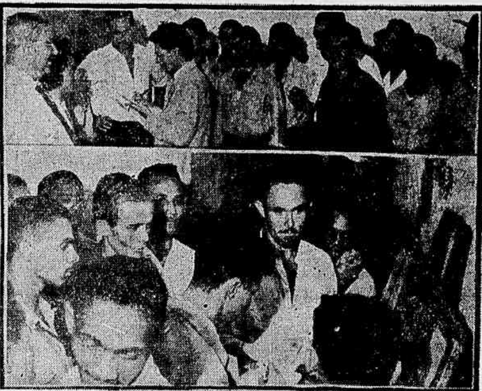
Marinheiros falando à IMPRENSA POPULAR, ocasião em que deram inteiro apoio ao M.N.T.P.

WASHINGTON, 25 (A. F. P.) — O número de casos de poliomielite que se declararam entre as crianças que foram inoculadas com a vacina Salk é atualmente de 88, anuncia o Serviço de Saúde Federal.