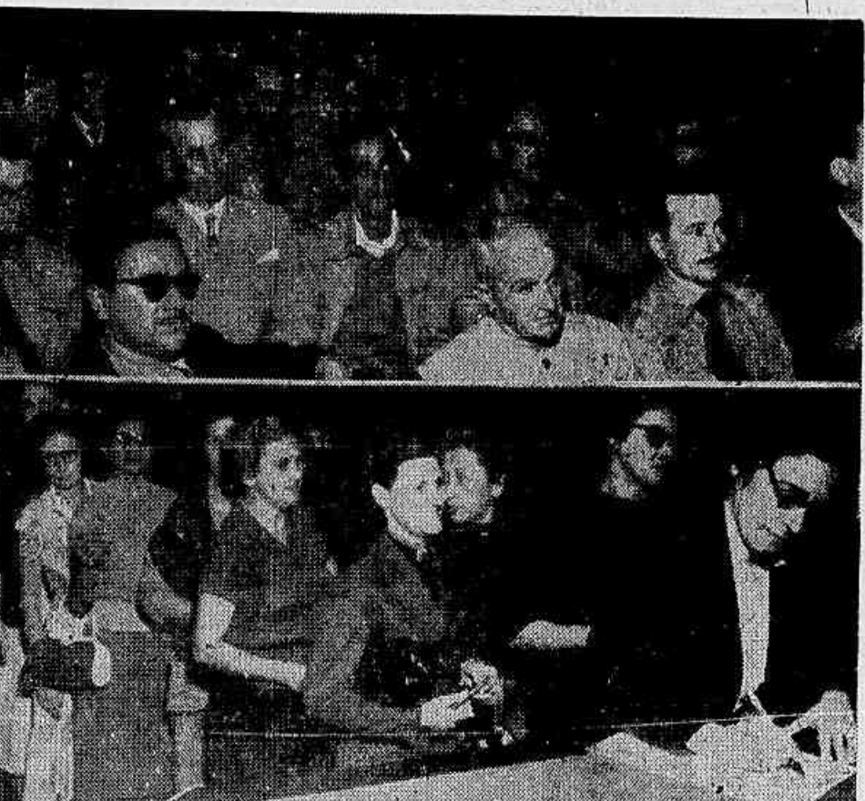
Dois flagrantes da assembleia dos funcionários do DCT, em cima, parte da assembleia e em baixo, agentes postalistas

Vão reunir-se hoje, a partir das 19 horas, na sede provisória da ACAID, à Rua Gustavo de Lacerda, 19, 1.º andar, as Comissões de Ajuda dos balneiros e empresários representados por seus diretores. Nesta reunião, os assistidos da ACAID vão discutir, entre outras coisas, a emissão de convites de financiamento, bem como sua participação no concurso Rainha da IMPRENSA POPULAR de 1955. A participação na reunião é obrigatória para os candidatos.