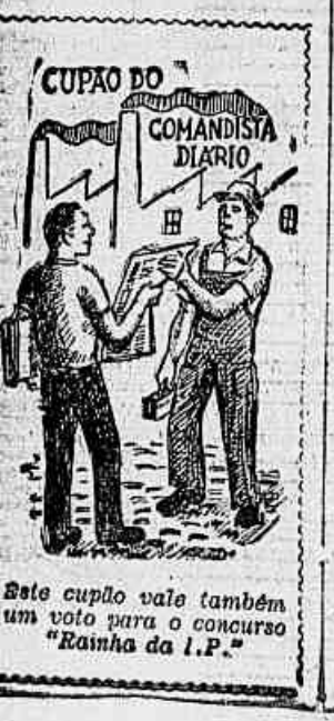
Este cupão vale também um voto para o concurso "Rainha da I.P."