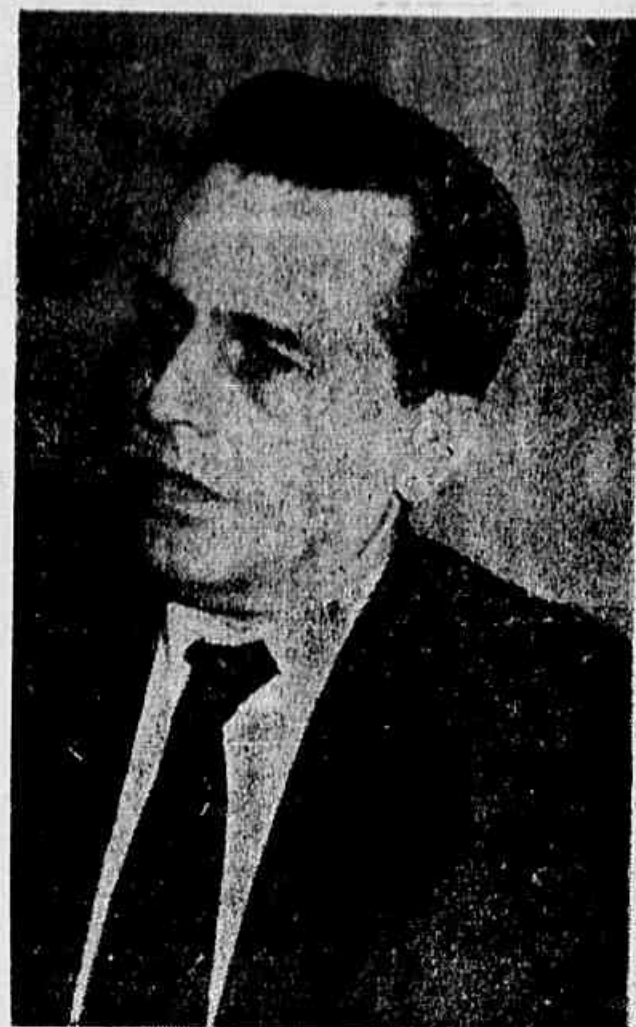
LUIZ CARLOS PRESTES

RESPOSTA — Sim, isto ainda é possível. Mas não é só no P.T.B. que se podem encontrar nomes de homens íntegros e capazes de lutar pela vitória do povo nas urnas de 3 de outubro. Quero mesmo fazer um apelo aos dirigentes do P.S.B., do P.S.P., do P.R.T. e demais partidos, correntes de opinião e movimentos e organizações que ainda não deram seu apoio aos candidatos até agora proclamados. O Partido Comunista dará seu inteiro e entusiástico apoio ao candidato de frente única das forças populares, democráticas e patrióticas que se comprometa a lutar em defesa da soberania nacional, contra a entrega do petróleo brasileiro à Standard Oil, em defesa dos interesses dos trabalhadores e da indústria nacional, por uma política de paz e de respeito à Constituição e por medidas eficientes contra a carestia da vida. Em torno de tal plataforma e com a escolha de dois patriotas dignos e honrados para candidatos do povo à presidência e vice-presidência da República será possível organizar uma amplíssima coalizão democrática que terá todas as condições para ser