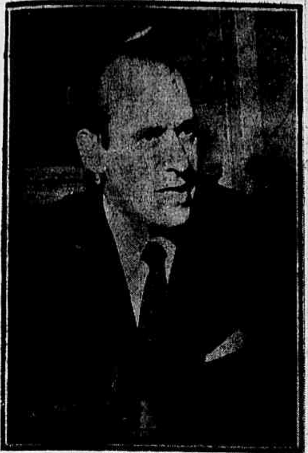
LINO DE MATOS