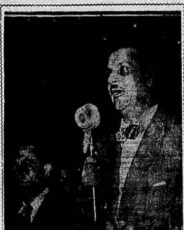
Afirma o Vice-Prefeito Eleito de S. Paulo:

Publicamos em nossa edição de terça-feira última importante entrevista de Luis Carlos Prestes ao Cavaleiro da Esperança. Embora com a tiragem aumentada a edição deste jornal estendeu-se rapidamente. Por este motivo tem nos sido impossível atender aos inúmeros pedidos de exemplares, que chegam continuamente à redação. Atendendo aos apelos por uma nova publicação da momentosa entrevista do Secretário Geral do P.C.B. reproduzimos-na na íntegra na terceira página desta edição.