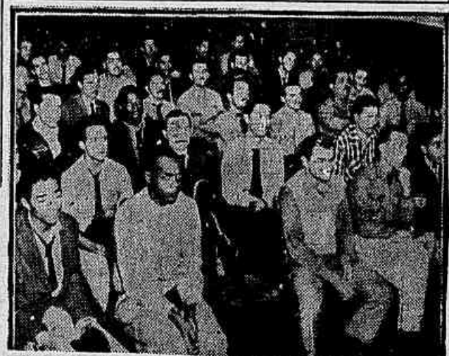
Fragmento parcial da sessão vespertina da assembleia dos trabalhadores em ônibus.

cício do voto, criando dificuldades tais que tornaria ainda menor o número de eleitores, já tão escasso, em nosso país.