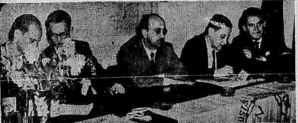
Aspecto da mesa que dirigiu os trabalhos, ontem, na assembleia promovida pela União Brasileira dos Servidores Postais e Telegráficos

lucros auferidos pela Light nos últimos anos.