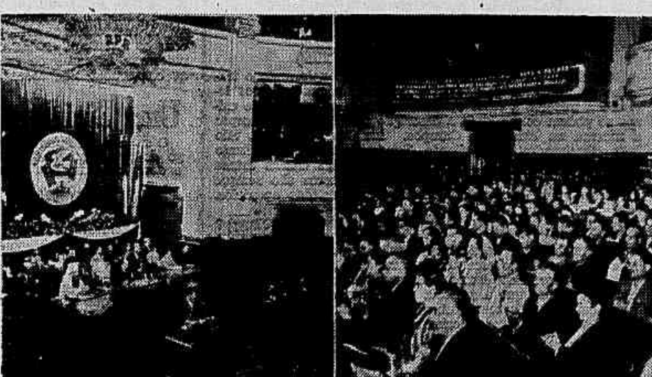
Realizou-se em Bucareste, na Rumânia, a Assembleia das Forças Pacíficas daquela República Popular. As delegações que participaram dos trabalhos da Conferência compunham-se de cientistas, intelectuais, operários, camponeses, personalidades religiosas e da vida política do país. No clichê, aspectos da sessão de encerramento da Assembleia.