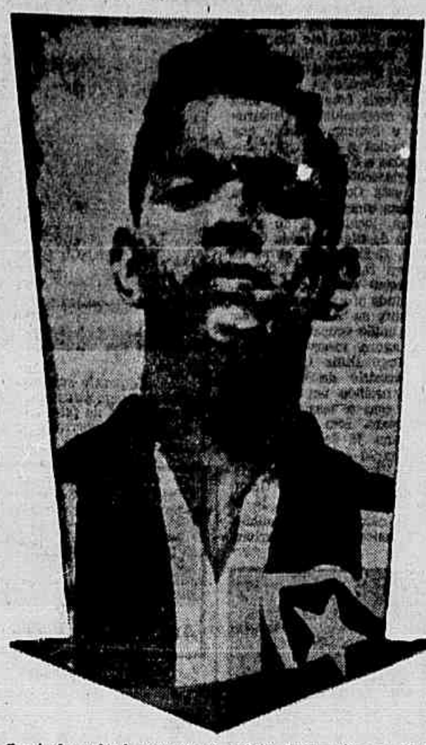
Garrincha estará presente ao cotejo desta noite em Paris

UM GRANDE COTEJO, ESTA NOITE, NA "CIDA DE LUZ" — O RACING É A EQUIPE DE IESO —