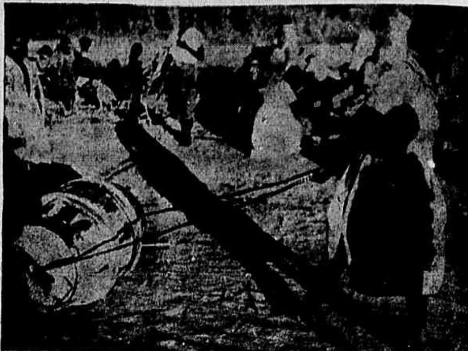
Enquanto centenas de milhões de cruzeiros (quase um bilhão) já foram gastos com as negociações da Tetracap, em plena capital da República repetem-se cenas como a que se vê na foto acima, dignas da Idade Média, o homem transformado em animal de tração para carregar água.

Ano VIII ★ Rio de Janeiro, quarta-feira, 1º de junho de 1955 ★ Nº 1.516