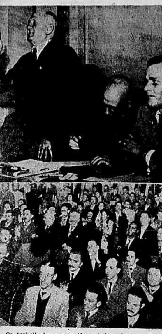
Os trabalhadores, que têm estado unidos nas lutas por suas reivindicações econômicas e sindicais, reúnem-se, agora, para a luta política. São eles que conduzem, agora, a campanha unitária por um candidato popular à sucessão presidencial, um candidato capaz de merecer a confiança do povo. No clichê, um fragmento da reunião do Movimento Nacional Popular Trabalhista, realizada em São Paulo e na qual ficou estabelecido o lançamento do nome do candidato, em convenção nacional dos trabalhadores.