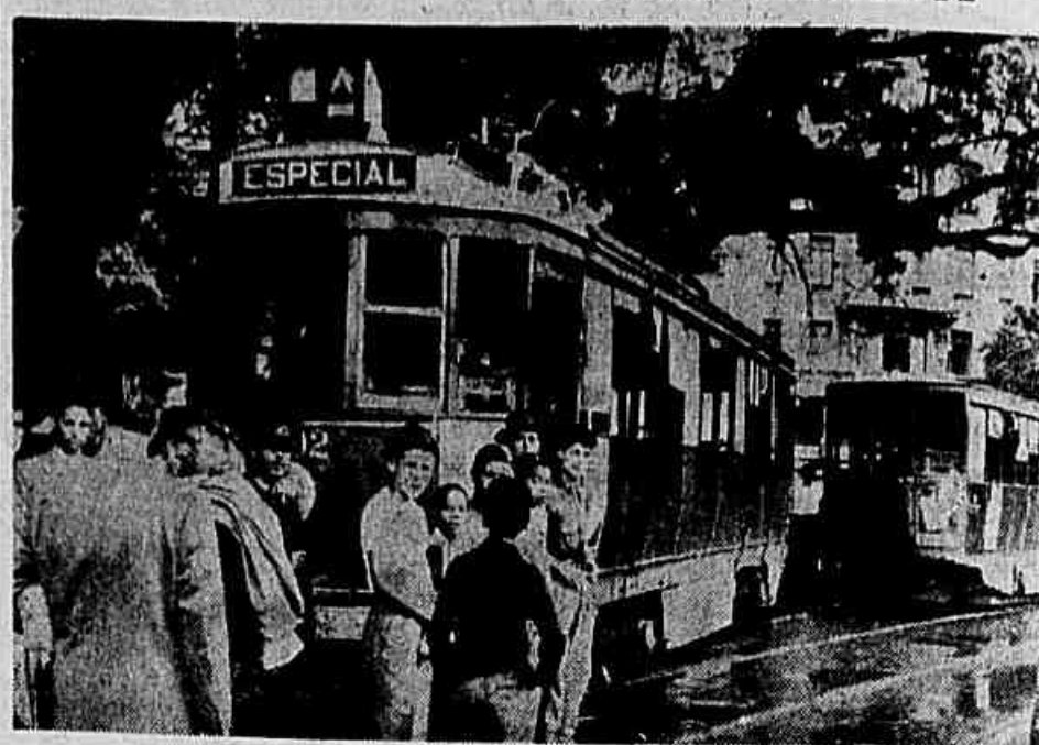
Cena da vida carioca, não, cena do inferno carioca. Um bonde saiu dos trilhos, ontem, em frente ao Passeio Público. Isto, às 8 horas da manhã, mas já passavam das 10 e lá estava ainda ele, como se o acidente tivesse ocorrido numa cidade despovoadas e a Light funcionasse a centenas de quilômetros distante do local. Cenas da vida, não, cenas do inferno carioca.