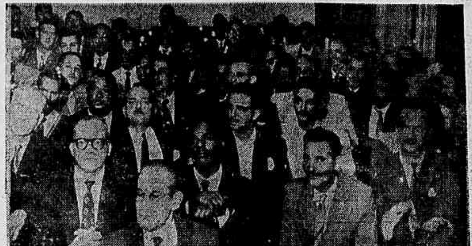
Trabalhadores em escritórios de companhias de navegação discutiram, ontem, sobre a criação do SAMPs (Serviço de Assistência Médica de Previdência Social) que inclui as famílias dos associados dos Institutos dos benefícios da assistência médica e resolveram iniciar uma campanha contra mais essa tentativa do governo de liquidação da assistência social. No clichê um aspecto da assembleia (TEXTO NA 5ª PAGINA)