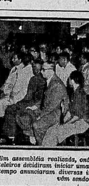
Em assembleia realizada, ontem, no sindicato — da qual é o flagrante acima — os hoteleiros decidiram iniciar uma campanha por aumento de 60% nos salários. Ao mesmo tempo anunciaram diversas irregularidades, contra os direitos dos trabalhadores, que vêm sendo cometidas por diversas casas do ramo

Eis um dos aspectos da situação de descalabro a que está abandonado o povo carioca.