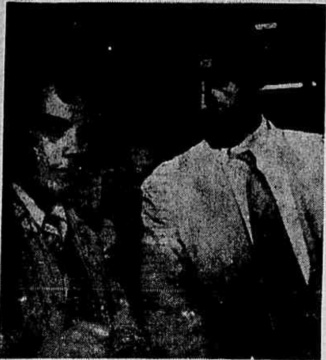
Quando o repórter buscava entre donas de casa sua opinião sobre a liberação dos preços da carne, o trabalhador marítimo que aparece no clichê fez questão de opinar. «Eu faço compras todo o dia e sei o que é a carência», disse-nos