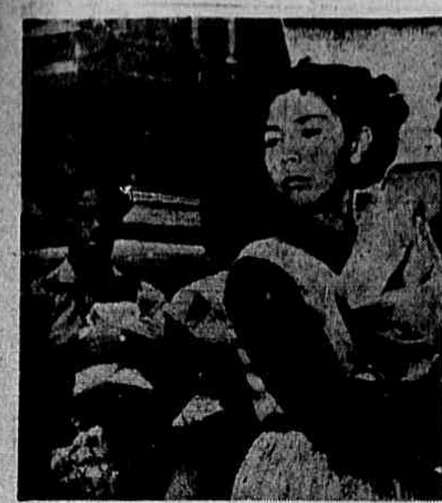
Sobre a liberação dos preços da carne a dona de casa falou: «Ora desse governo a gente não pode esperar outra coisa»