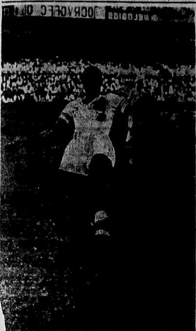
Escutinho, ponteiro tricolor