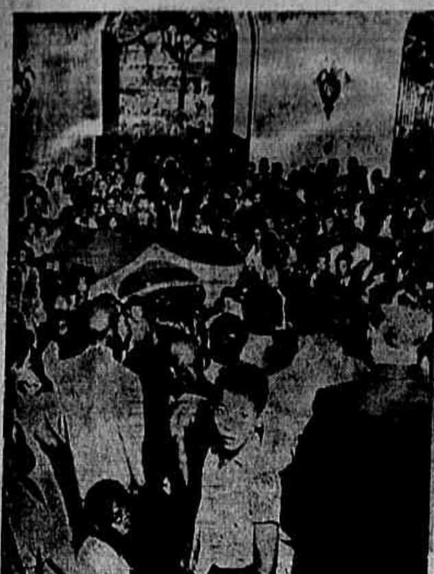
Favelados do Morro de Santa Marta em uma de suas visitas à Câmara Municipal, para defender reivindicações. O governo não os atende, mas a U.T.F. acaba de fundar um posto médico naquela morro

A anulação do artigo 231, medida pleiteada pelo líder da U.D.N. Gladstone Chaves de Melo, é uma medida tipicamente de classe, pois os medalhões da Câmara continuaram beneficiados, enquanto os pequenos funcionários não terão direito a menores