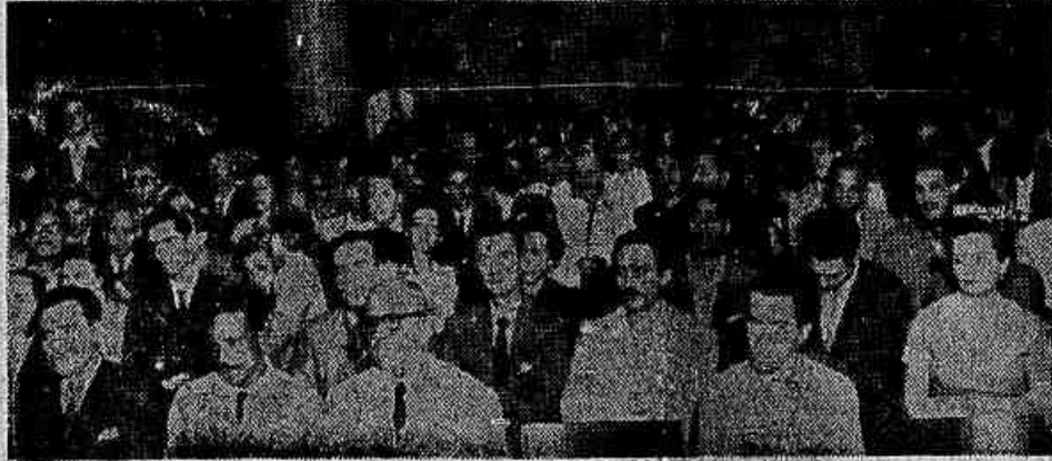
Aspecto da concorrida sessão de encerramento da reunião do Diretório Central da Liga da Emancipação Nacional

Definida a posição da LEN em face do pleito eleitoral — Relações comerciais com todos os países — General Edgar Buxbaum: «Unir os patriotas e combater o entreguismo» — (TEXTO NA 2ª PAG.)