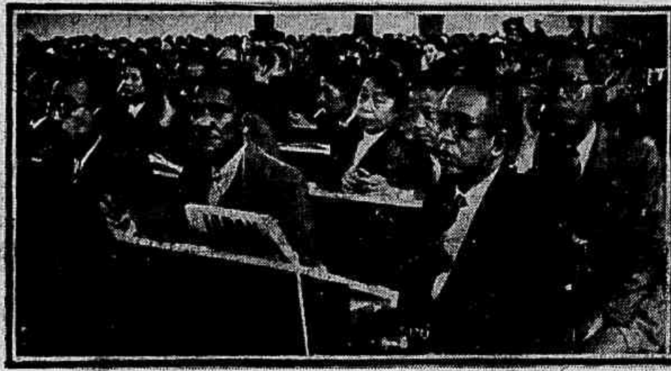
Flagrante de uma reunião plenária da Assembleia Mundial da Paz, realizada em Helsinque, destacando-se, em primeiro plano, a delegação do Japão