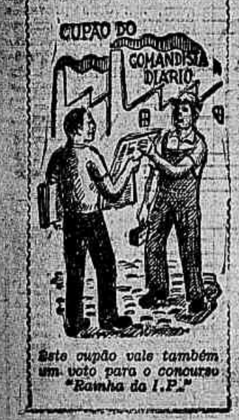
Este cupão vale também um voto para o concurso «Rainha da I.P.»

AVISO Será publicado brevemente um plano de finanças trimestral da IMPRENSA POPULAR e da ACAID, tendo como objetivo à sua sede própria. Acha-se em poder da ACAID um pequeno pacote com dinheiro. Quem o perdeu é favor procurar à Rua Gustavo Lacerda, 19, sobretudo, das 15 horas em diante.