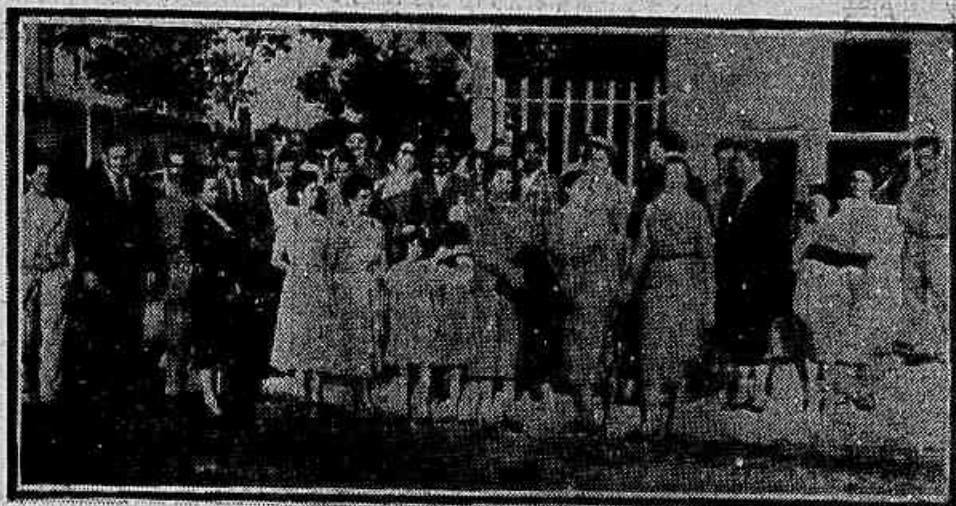
Parte da delegação brasileira ao Congresso de Mães que se instala hoje em Lausanne

Realizam-se as Convenções regionais ao mesmo tempo em que se organizam novas Seções Estaduais — Surge o M.N.P.T. na Bahia, no Pará, no Paraná — Reivindicações locais — Eleições de delegados