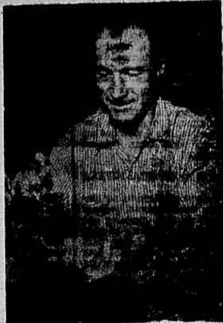
Lugano entusiasma os italianos

Os jogadores brasileiros demonstraram — como já o tinham feito no jogo anterior com aquela equipe mista — um jogo de combinação, cuja eficácia apenas pode ser comparada com a pureza dos movimentos.