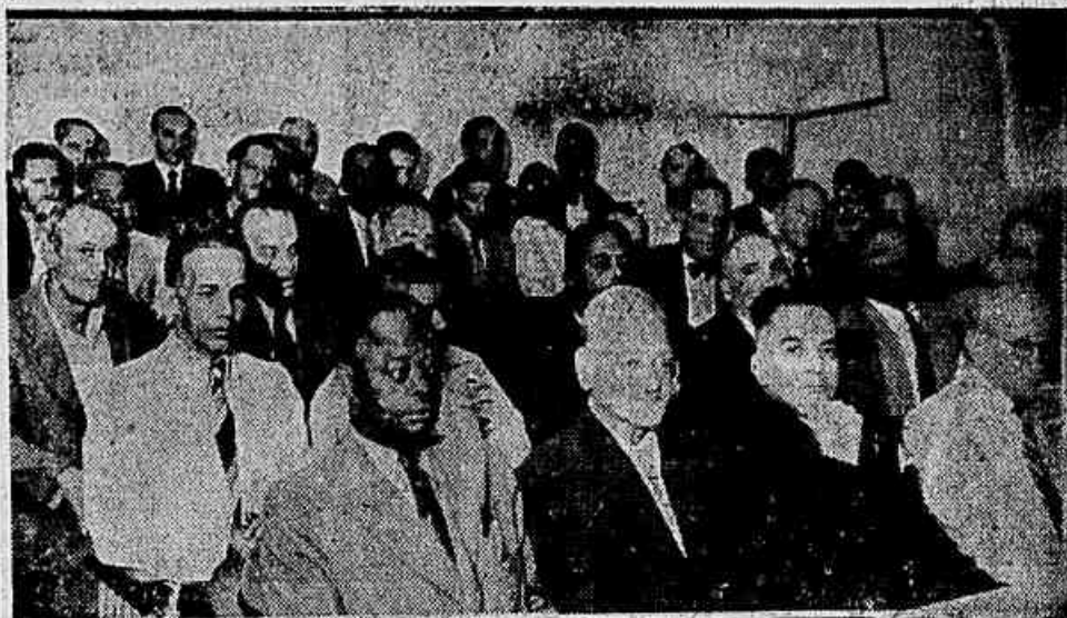
Os servidores da Central do Brasil ontem reunidos na Associação Médica do Distrito Federal, aprovaram as seguintes reivindicações para que constem no Plano de Reclassificação: Agentes A, pedem sua elevação de 7 para 9; agentes B, de 8 para 10; agentes C, de 10 para 12; agentes D, de 12 para 14; fiscal de tráfego, de 13 para 15; inspetor de tráfego, de 14 para 16; guarda-chaves, de 2 para 4. (Aspecto da reunião).