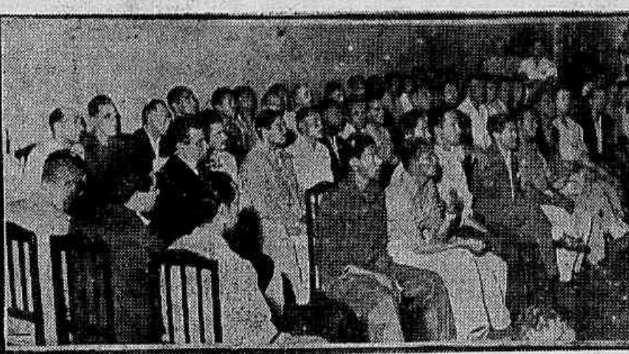
Os marítimos desempregados realizarão, depois do Congresso Eucarístico, uma passeata à Câmara Federal. Essa foi uma das medidas adotadas na mesa-redonda, ontem realizada, no Sindicato dos Foguistas, em que se debateu o grave problema do desemprego na Marinha Mercante. Na foto, um aspecto da assistência. (Leia na 2ª página).