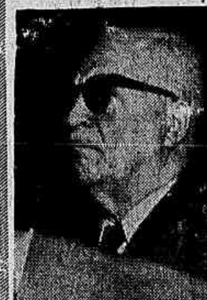
General Pantaleão Pessoa

O ex-presidente da COFAP, falando à IMPRENSA POPULAR, diz que um novo círculo de aumentos se seguirá ao assalto projetado pelo governo