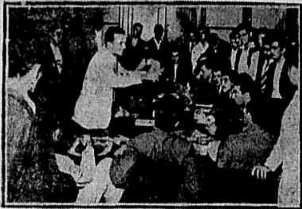
Depois da denúncia feita na reunião da delegação carioca ao Congresso Nacional dos Estudantes (da qual é o flagrante acima), o governo recuou e fornecerá as passagens.

A GRAVE denúncia dos universitários cariocas, delegados ao XVIII Congresso Nacional de Estudantes, de que o governo do sr. Café Filho tentou suborná-los em troca das passagens da delegação metropolitana para Belém do Pará, onde se realizará o conclave, encontrou intensa repercussão, inclusive na imprensa de todo o país. Apontado como um governante corrupto e corruptor, que não recua, sequer, nas tentativas de dobrar o caráter da juventude, o sr. Café Filho e o ministro Cândido Motta Filho viram-se obrigados a bater imediatamente em retirada. Ao receberem, ontem, no Palácio do Catete, uma comissão de diretores da União Metropolitana e da União Nacional de Estudantes, Café e o ministro da Educação asseguraram que entregariam, agora, as (CONCLUI NA 2ª PAG.)