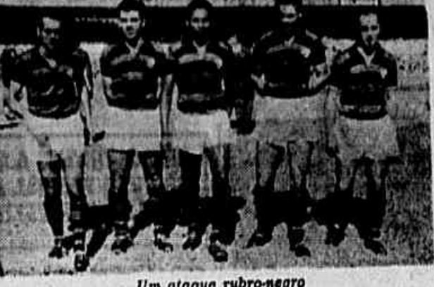
Um ataque rubro-negro