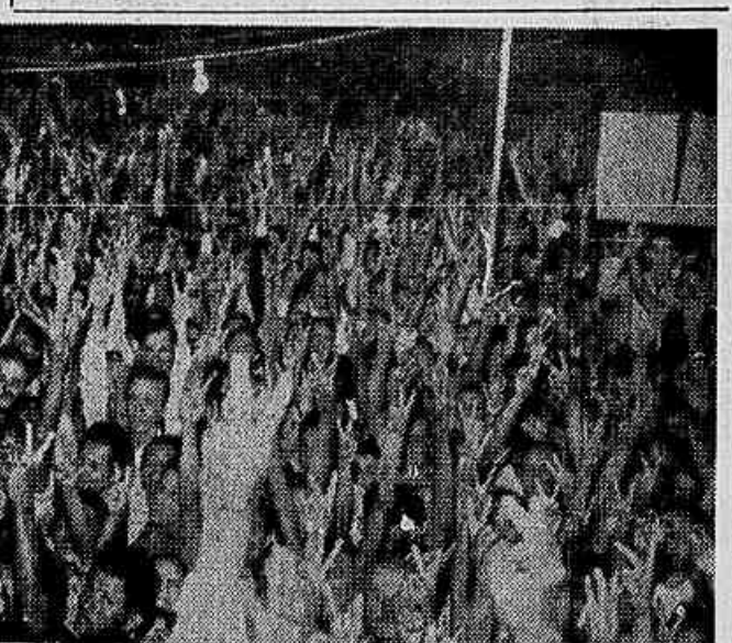
Éis um aspecto da impressionante manifestação do povo baiano de apoio ao candidato das forças antigolpistas, sr. Juscelino Kubitschek. Na Praça da Sé milhares de pessoas, durante longo tempo, aplaudiram a caravana que desfalece a bandeira da defesa da Constituição