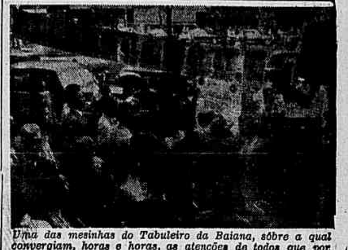
Uma das mesinhas do Tabuleiro da Baiana, sobre a qual converciam, horas e horas, as atenções de todos que por ali passavam

Não temos motivos para (CONCLUI NA 2ª PAG.)