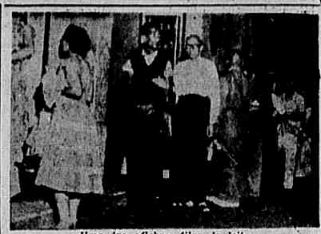
Uma das célebres filhas do leite

carga da Prefeitura, não é feita, o que provoca obstrução dos coletores que ficam muitas vezes com as respectivas seções de vazão reduzidas a um terço da capacidade. Mais de 70 por cento dos casos de obstrução ocorrem nas redes pluviais como é o exemplo da Fundação da Casa Popular, em Deodoro, cuja rede de esgoto é motivo de constantes reclamações, pois frequentemente está entupida. Tais fatos demonstram a responsabilidade do prefeito Almiro Pedro e da Secretaria de Saúde da Prefeitura no surto de tifo que ameaça agravar.