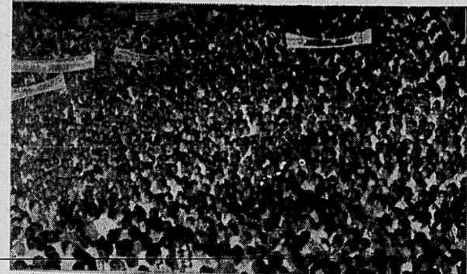
De braços abertos a população de Belém acolheu o sr. João Goulart, candidato à Vice-Presidência da República. Nos braços do povo Jango foi lavado do pó da capital paraense ao centro da cidade

nhã começaram a afluír populares àquela praia fluminense, em grupos alegres, (CONCLUI NA 2ª PAGINA)