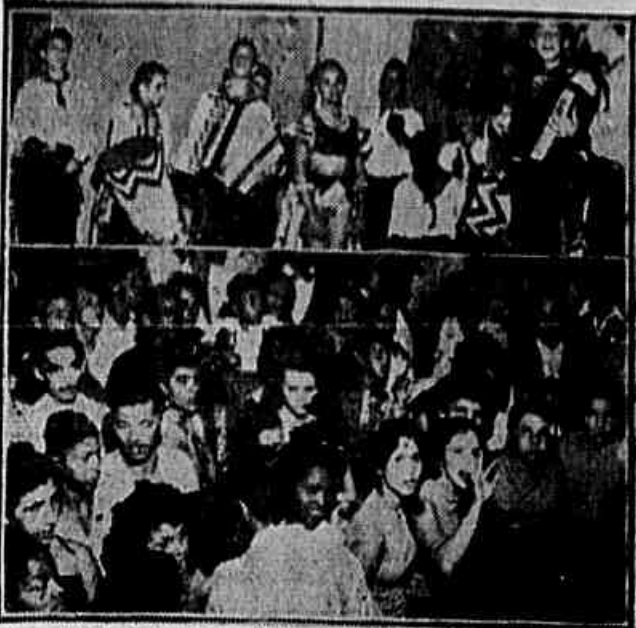
Em cima a orquestra típica de rumba que abriu a festa e em baixo uma parte do público, ouvindo o "show"

OS AJUDISTAS e amigos da IMPRENSA POPULAR resolveram promover uma justa comemoração do Dia da Independência, realizando um comando gigante para a venda de 50.000 exemplares do nosso jornal nos bairros e subúrbios do Distrito Federal. Nossa edição de amanhã será levada às mãos de milhares e milhares de novos leitores, que tomarão conhecimento por meio dela, das lutas patrióticas do povo brasileiro. Milhares de cartões receberão a palavra clara e justa para se orientarem diante da campanha eleitoral em curso, fortalecendo as fileiras de combate contra o golpismo e em defesa da Constituição. O comando de amanhã será uma importante iniciativa (CONCLUI NA 2ª PAG.)