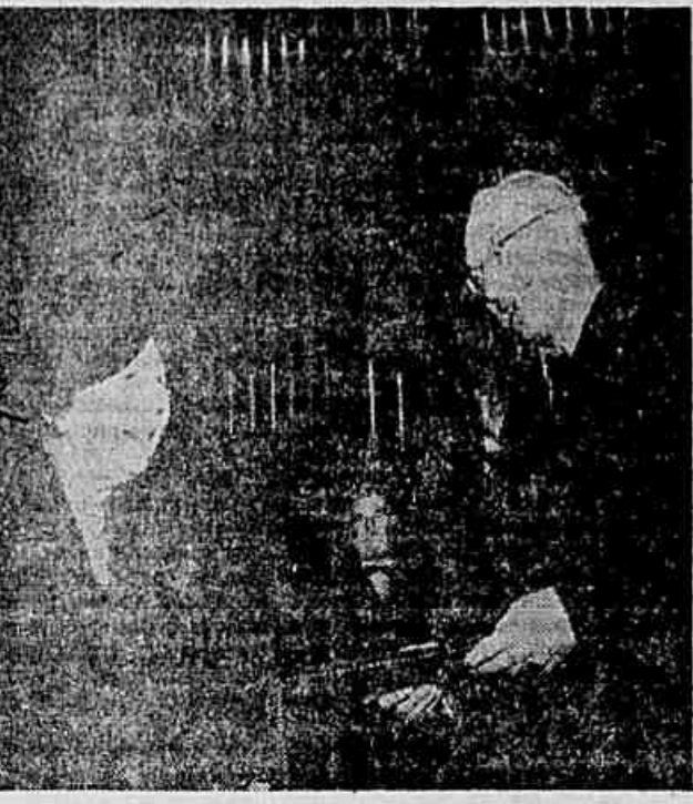
O Conselho Artístico do Conservatório "P. I. Tchikowski" de Moscou, resolveu conferir o título de Professor Honoris Causa à pianista francesa Marguerite Long. A famosa intérprete, muitas vezes aplaudida no Rio, deu vários concertos na União Soviética.

Vigorosamente, afirma: «As razões e argumentos apresentados pelo titular da Empresa Segreto mal escon-dem a desmedida ambição por maiores lucros, embora isto resulte no desemprego de centenas de abnegados trabalhadores teatrais. Do mais humilde porteiro à mais famosa vedeta amargurada nas consequências da ganância dos empresários...»