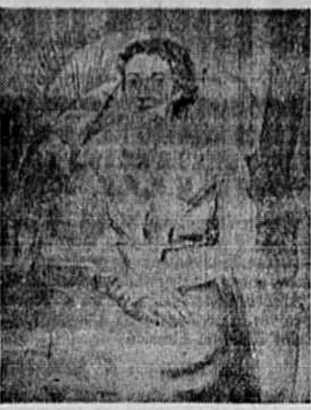
Retrato de "Jamilia" é o título da tela que reproduzimos ao lado, obra do jovem pintor Israel Pedrosa, cuja exposição na sala do Diretor da Escola Nacional de Belas Artes foi inaugurada no dia 1º do corrente e que ficará aberta ao público até o próximo dia 16.