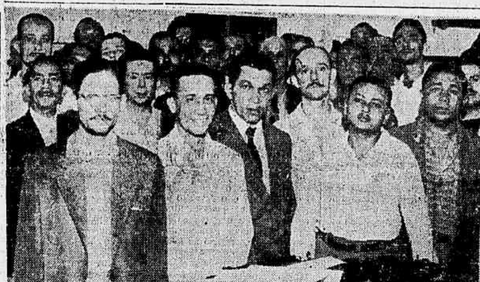
A grande comissão de trabalhadores navais da Ilha do Viana que ontem esteve em nossa redação narrando os detalhes da greve com que forçaram a Navegação Costeira a pagar o abono que estava atrasado

EM atitude de verdadeira provocação aos metalúrgicos de Volta Redonda, o Delegado Regional do Trabalho do Estado do Rio, Fenelon de Souza, homem de confiança de Alencastro Guimarães, continua mantendo bloqueados os depósitos bancários do Sindicato