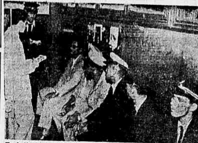
Trabalhadores falando à nossa reportagem sobre a entrevista do Luiz Carlos Prestes a respeito do resultado das eleições

Declarações do delegado sindical dos trabalhadores da Ferro Carril Carioca — Diversos operários, unânimes, apóiam as afirmações do Cavaleiro da Esperança