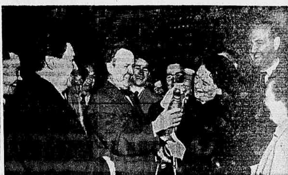
Está recentemente em visita à União Soviética, o ministro dos Negócios Exteriores do Canadá, sr. Pearson. No clichê, vemos-o em companhia de sua esposa, no pavilhão da Ucrânia, na Exposição Agrícola de Moscou, examinando uma vasilha para vinho, trabalho dos mestres artesãos de Kumanets, presente do diretor da Exposição, acadêmico Tsi-tsin. (Foto distribuída pela Inter Press).