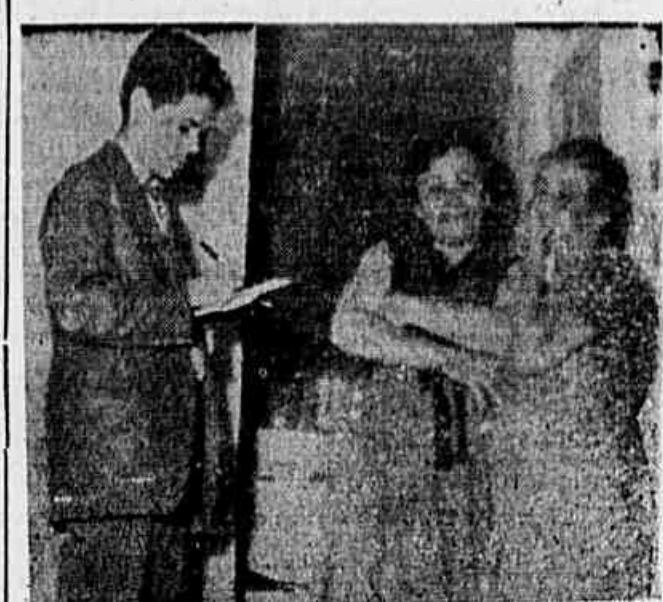
Moradores do Conjunto Residencial da PDF, na Gávea, quando falavam a nossa reportagem protestando contra o aumento da Prefeitura.

A organização de comissões que pressionam os conselheiros da COFAP, é um método já provado, de que dispõem os trabalhadores. As donas de casa, os estudantes para impedir a autorização desses aumentos injustificáveis e imorais.