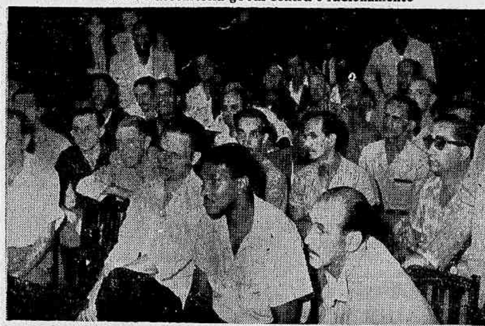
Aspecto da reunião em que os operários do Moinho Inglês decidiram só voltar ao trabalho quando os patrões revogarem a decisão de modificar o horário do trabalho

Com a adesão da segunda turma, os trabalhos estão praticamente paralisados naquela empresa — Coniventes os patrões com a Light — Grande assembleia geral contra o racionamento