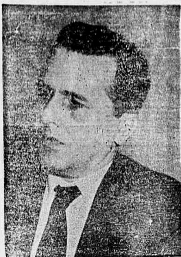
LUIZ CARLOS PRESTES

★ APELAMOS PARA TODOS OS PATRIOTAS E DEMOCRATAS, INDEPENDENTEMENTE DO PARTIDO A QUE PERTENÇAM OU DOS CANDIDATOS EM QUE VOTARAM EM 3 DE OUTUBRO, PARA QUE SE UNAM E LUTEM PARA ASSEGURAR O RESPEITO À VONTADE DO POVO.