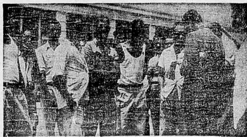
Operários do Curtume Carioca quando falavam à nossa reportagem