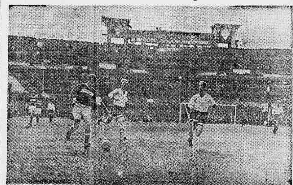
Em prosseguimento ao campeonato de futebol da União Soviética, pelotaram em outubro último, no Estádio Central do Dinamo, em Moscou, as equipes do Dinamo e do Espartaco, cabendo a vitória a esta última, pela contagem de 2x1. Na foto, um jogador do Espartaco carrega a pelota, acochado por dois defensores do Dinamo.