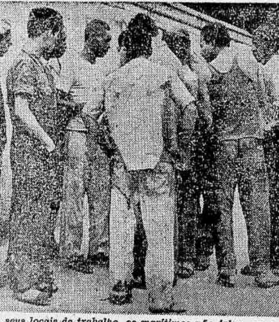
Em seus locais de trabalho, os marítimos não falam em outra coisa senão no aumento que estão pleiteando. Para conquistá-lo, precisam de liberdade sindical. Por isso lutam também contra o golpe, pela posse dos eleitos

Prova de que os golpistas temem o ascenso do movimento operário como o maior obstáculo a seus planos são as «teses» que eles procuram difundir como a de que «as lutas operárias são um pretexto para o golpe». E outros fatos, como o envio de um grupo de adestrados pelagos ministerialistas a São Paulo para tentar arrefecer as lutas reivindicatórias, as segundas tentativas de intervenção e de bloqueamento das contas dos sindicatos, mais combativos. Os golpistas querem amarrar as mãos da classe operária, a parcela mais combativa do povo, para tornar possível a implantação da ditadura que Wall Street precisa e exige.