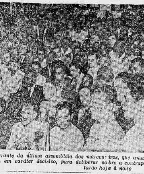
Flagrante da última assembleia dos marceneiros, que amanhã voltará a se reunir, desta feita em caráter decisivo, para deliberar sobre a contraproposta que os patrões apresentaram hoje à noite