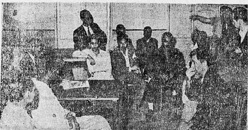
Ante a ferrea unidade dos metalúrgicos de Volta Redonda, mais uma vez o governo mordeu o pó da derrota; já foram liberados 200 mil cruzeiros dos depósitos do sindicato. E o diretor do DNT anuncia que não mais quer intervir na entidade. Na foto, diretores e líderes dos metalúrgicos da Cidade do Aço quando reuniram-se para orientar seus companheiros. (Texto na segunda página).