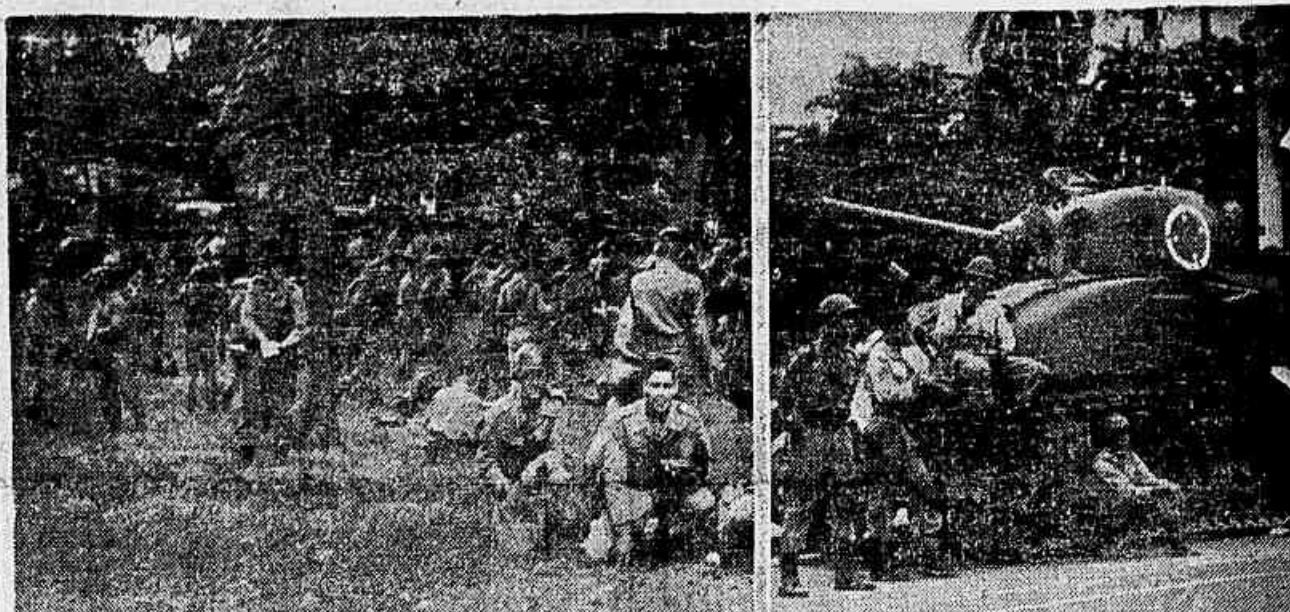
Grande movimento de tropas observou-se na tarde de ontem no Campo do Santana. Em nota oficial do Ministério da Guerra a população foi informada de que se tratava apenas de um teste de presteza determinado por ordem superior. Assim foi desfeita a onda de boatos logo explorada pelos golpistas que procuram inquietar o povo. O teste de presteza revelou que o Exército está em condições de esmagar rapidamente qualquer arremesso golpista.