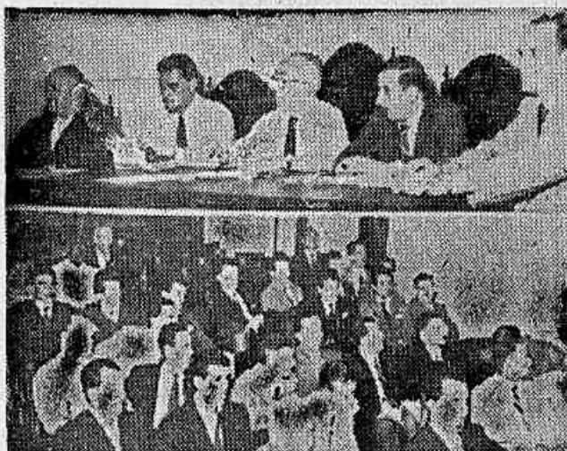
Aspecto da mesa e do plenário da reunião em que foi deliberada a ação operária em plano nacional em defesa da legalidade democrática