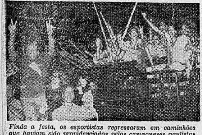
Finda a festa, os esportistas regressaram em caminhões que haviam sido providenciados pelos camponeses paulistas

A LIDERANÇA Com as duas vitórias conquistadas, a representação do Leopoldina ocupa a liderança do torneio, que terá prosseguimento no próximo domingo. Os clubes que faltam atuar no torneio são: Oriental, Fronteira, XV de Novembro e Santa Lúcia.