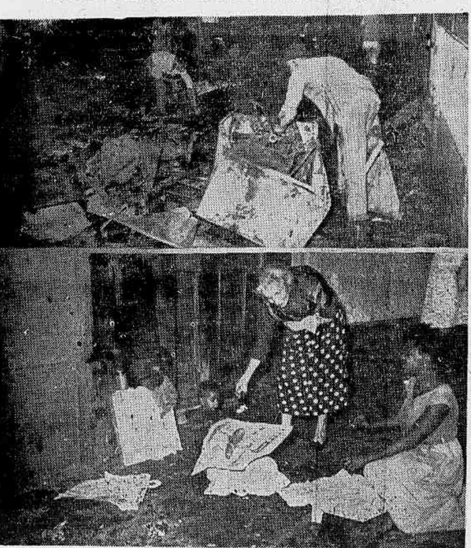
Estes flagrantíssimos fixados ontem, pela objetiva de nosso fotógrafo são um atestado eloquente da miséria de nosso povo. Co mo se observa, populares famintos procuram achar no monturo de lixo um objeto de valor ou um pão dormido, para enganar o estômago. Naquela local, proximidades dos Arocs, houve um incêndio há quinze dias.