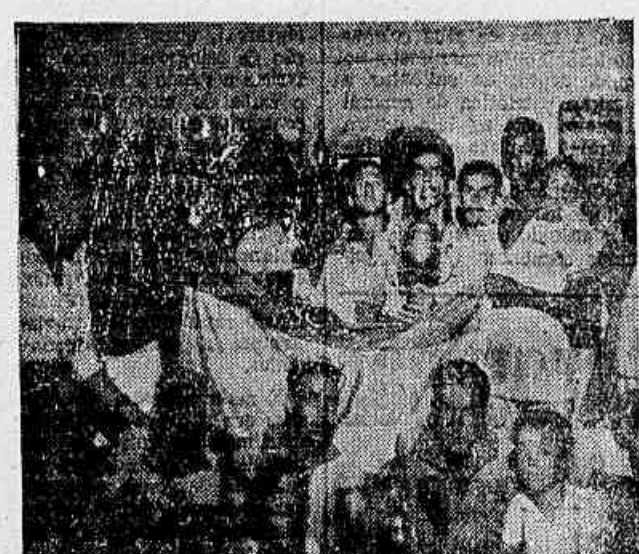
Torcedores, atletas e diretores do Ouro Verde festejando a conquista do título de campeão

Depois de vários adiamentos por parte do E. C. Centenário, foi marcado para o último domingo o derradeiro compromisso do «Torneio» em que se confraternizaram o líder Ouro Verde F. C. e o clube da Zona Árabe.