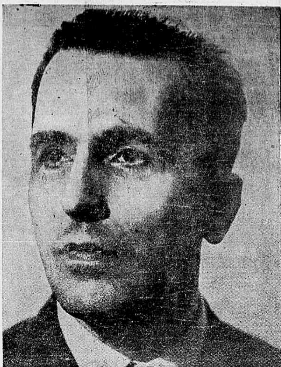
LUIZ CARLOS PRESTES

Contra as tentativas criminosas no sentido de derramar o sangue do povo em proveito dos monopólios norte-americanos e de seus agentes brasileiros, unamo-nos! Unidos poderemos enfrentar e resolver os problemas mais graves que exigem urgente solução em benefício da democracia, do bem-estar do povo e do progresso do Brasil.