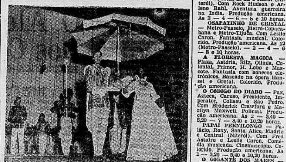
O maracatu, número de grande sucesso do repertório do TPB