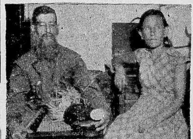
O anão, vítima da violência policial, acompanhado pela imprensa POPULAR, o que lhe restou de seus apetrechos de trabalho, um fundo de cadeira. As ferramentas a polícia não devolveu

Foi Fazer a Denúncia e Ficou Encarcerado — Os Policiais Não Devolvem Suas Ferramentas de Trabalho