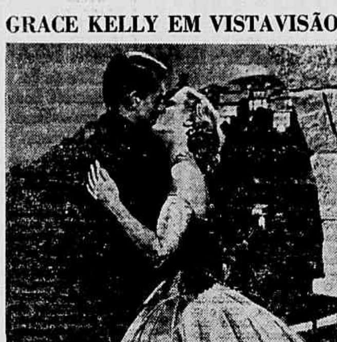
A nova película de A. Hitchcock, a ser brevemente apresentada entre nós, e que se intitula «Ladrão de Casaca» foi realizada pelo novo processo denominado Vista-vision. O processo consiste na utilização de negativos de maior duração do que os de 16 mm. No elenco estão Cary Grant e Grace Kelly.

VITÓRIA (Do correspondente) — A população do Espírito Santo está enfrentando uma autêntica seca em decorrência da insólita atitude da subsidiária da Bonda and Share, a Central Brasileira que é concessionária dos serviços de água de Vitória. Com efeito, enquanto os assistidos reclamam o fornecimento de água à cidade de Vitória e a empresa que detém o controle do serviço recusase a efetuar a ligação de uma nova estação fornecedora, que embora já concluída não foi inaugurada. Com tal atitude a subsidiária norte-americana objetiva obter do governo do Estado uma verba de 5 milhões de cruzeiros destinados pelo jornal «Folha Capixaba» mister Brown, um dos direto-