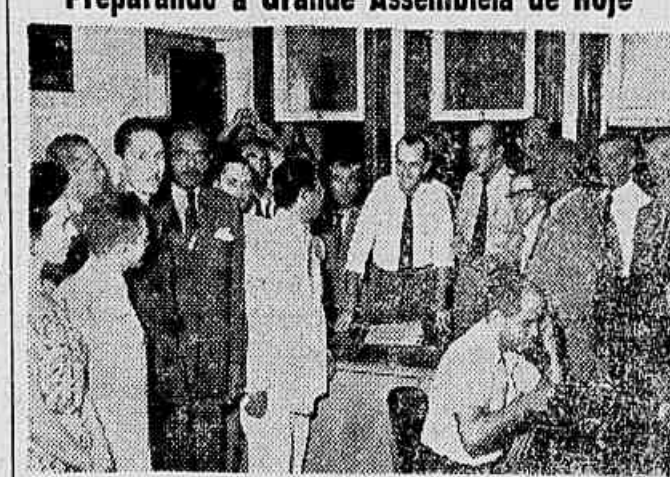
Representantes de várias entidades filiadas à UNSP, quando tomavam providências, na sede daquela entidade, para o comparecimento em massa à grande assembleia de hoje, na Associação Brasileira de Imprensa