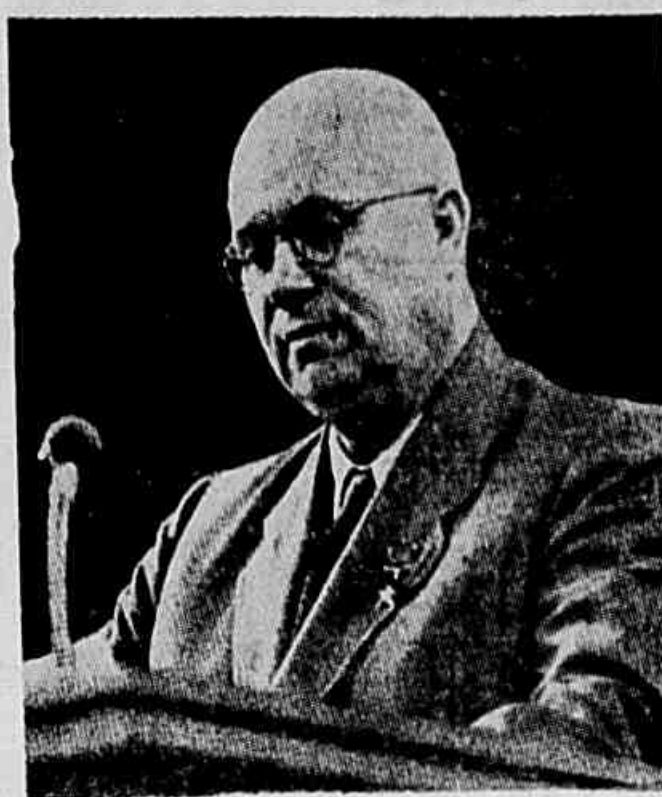
N. S. KRUCHTCHEV

«Todos os acontecimentos que ocorreram desde o XIX Congresso, em outubro de 1952, demonstraram que houve mudanças essenciais na situação internacional, e isso no sentido do fortalecimento do socialismo. Com efeito, a nossa época é principalmente caracterizada pelo fato de que o socialismo