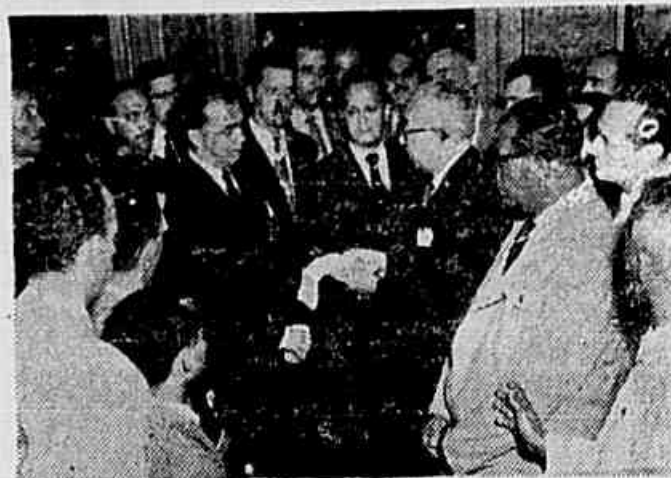
Flagrante na entrevista dos líderes sindicais, ontem, com o presidente da República