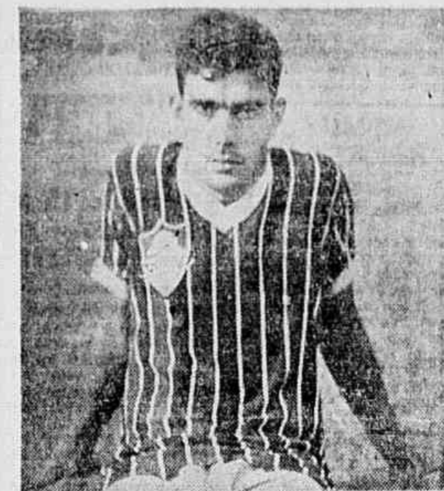
Caca, provável baixa tricolor para o grande jôgo com o Vasco

B. AIRES, 24 (AFP) — Está em Buenos Aires o presidente da Liga Paulista de Futebol, que realiza negociações com os clubes independentes e Boca Juniors, para a participação de ambos os clubes no torneio internacional a se realizar em S. Paulo, a partir de 11 de março próximo. O Independiente não poderia aceitar porque deve jogar em Lima.