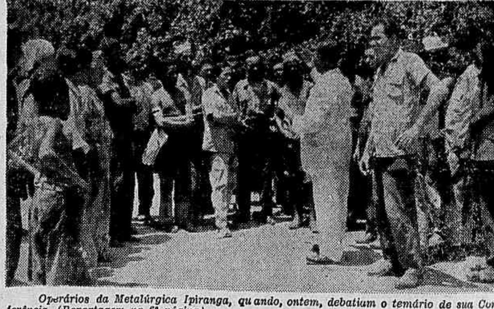
Operários da Metalúrgica Ipiranga, quando, ontem, debatiam o teor da sua Conferência. (Reportagem na 6ª página).