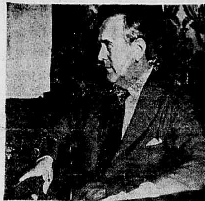
Embaixador OSVALDO ARANHA