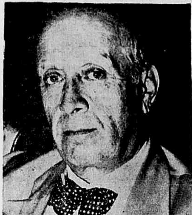
General FLORES DA CUNHA

as instituições se definirem. Não é mais possível vivermos num regime de descrédito, de desconfiança e de interinidade política. Sem a pacificação da família brasileira, será impossível a estabilização da própria democracia. Já é momento de iniciarmos vida nova, dentro de um critério mútuo de confiança, como condição de solidariedade de todas as forças. (CONCLUI NA 2ª PAGINA)