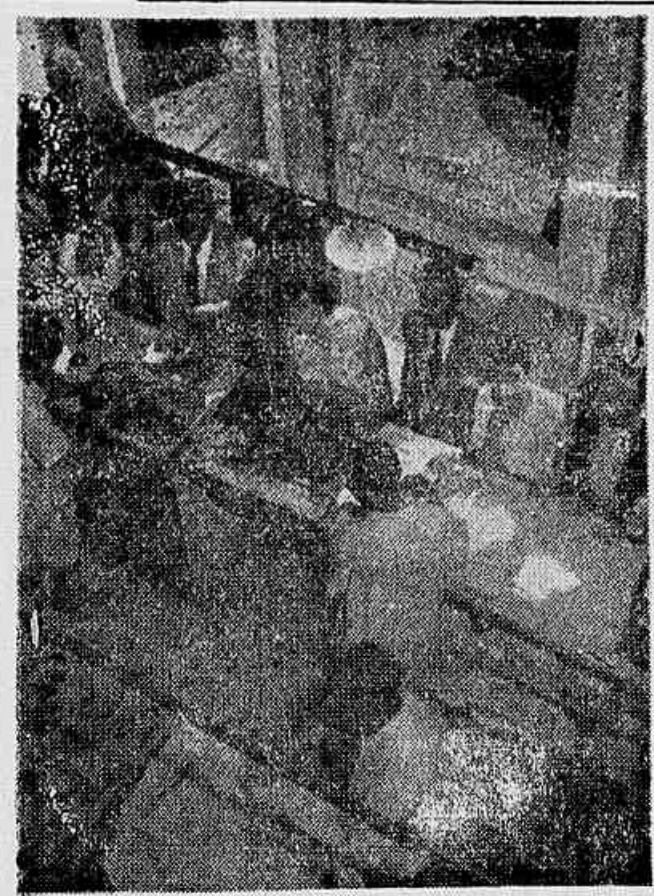
As donas de casa reclamam medidas contra a carestia da vida. E o tabelamento da carne é uma das suas reivindicações mais sentidas

cráticas e pelas reivindicações nacionais que no momento se apresentam em primeiro plano. Entre estas se destacam, pela sua alta importância, a anistia a todos os condenados e processados por motivos políticos, com