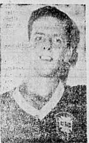
Mauro substituirá Bibi

A EQUIPE do Bonsucesso já está escalada para o compromisso de amanhã contra o América, quando