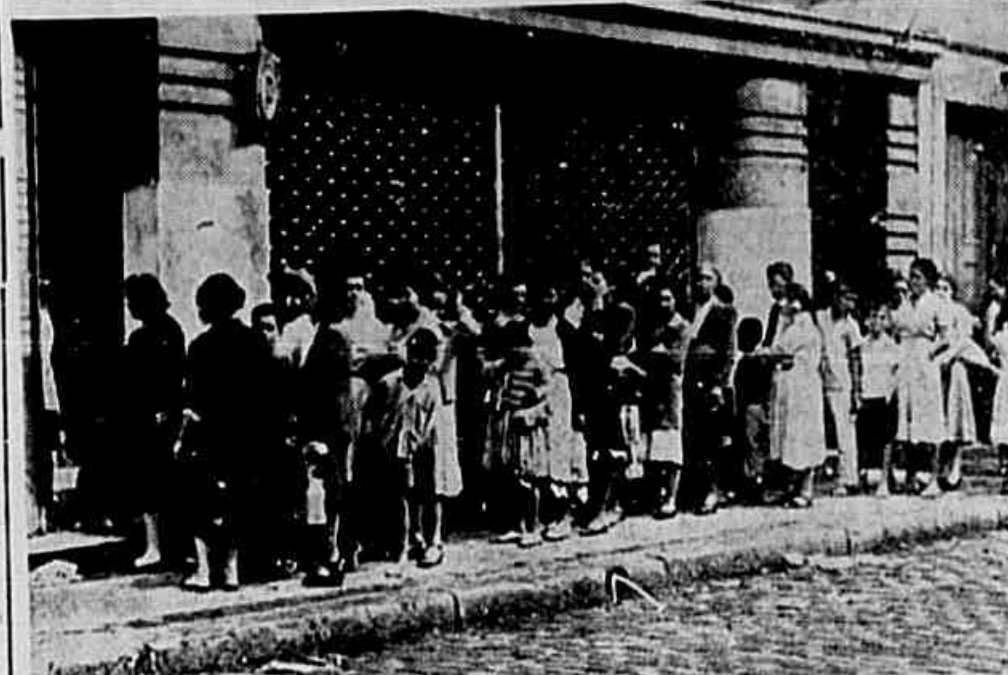
Os açougues fecharam suas portas por ocasião da vigência da portaria 280 que isentava os frigoríficos do controle de preços — Em consequência do justo movimento dos açougues os preços da carne ficaram à população sem carne — Por muitas semanas os açougues ficaram às portas fechadas — Agora, pretendendo adotar o controle de preços, os açougues voltaram a trabalhar — As donas de casa voltaram às filas para a compra de carne verde

que amanhã tenhamos de comprar carne com prejuízos para vendê-la à população ou, em caso contrário, sofrer as sanções penais previstas. Lutaremos, isto sim, por um tabelamento justo e que inclua desde os inventistas, matadouros e frigoríficos. E preciso que a COFAP saiba que nós não fabricamos carne, vendemos a carne que compramos aos frigoríficos e mediante uma retribuição financeira.