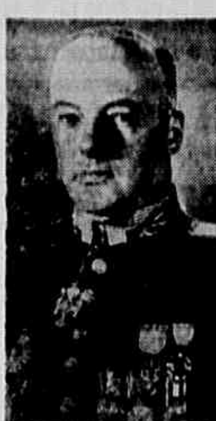
Gen. Teixeira Lott