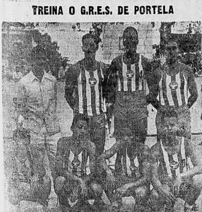
O G.R.E.S. Portela vem treinando com afinco para, dentro em breve, enfrentar os mais valiosos esportistas do esporte da rede e da costa, dos subúrbios metropolitanos

A direção do G.R.E.S. tudo tem feito para que os seus atletas possam, ante o preparo físico e técnico, demonstrar suas excepcionais qualidades ao enfrentar seus antagonistas. (Na foto, a equipe do G.R.E.S. e seus reservas, após um treino demorado).