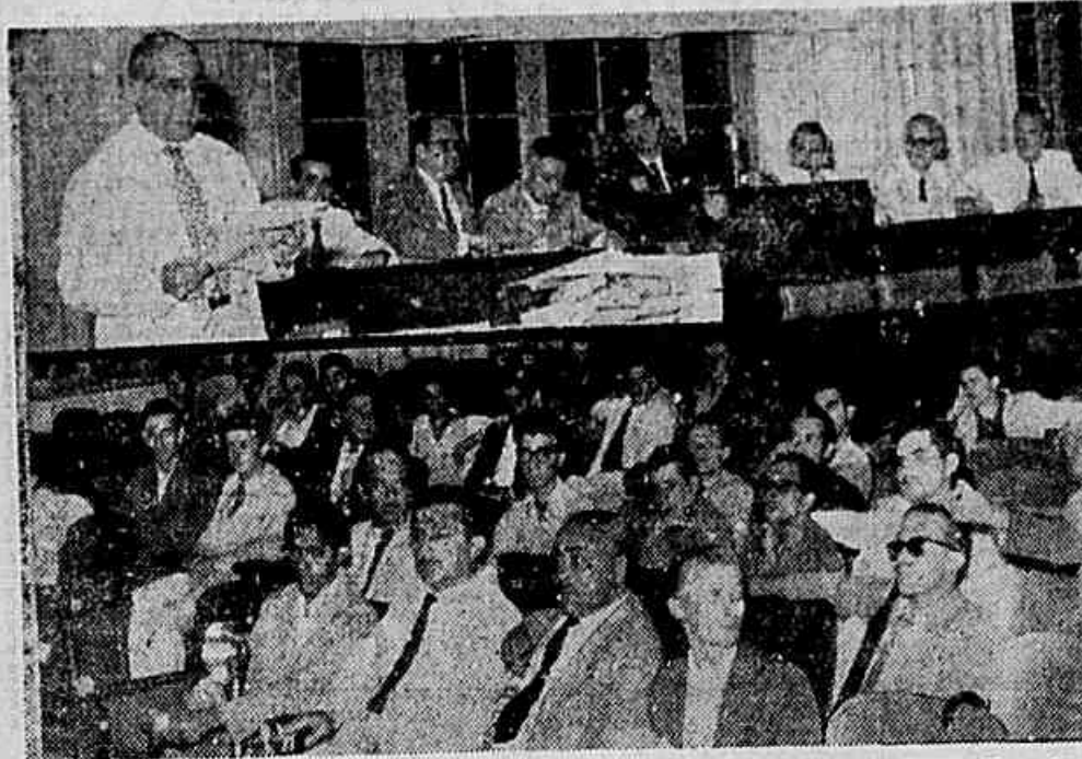
Dois aspectos da reunião dos estudantes, anteontem, na sede da UNE. Em cima, a mesa dirigida pelo presidente da UNE, vendo-se os conselheiros da COFAP. Em baixo, a assistência.

Compareça à Festa promovida pela Associação Feminina do Distrito Federal, em homenagem ao DIA DA MULHER Grupo Cênico da Associação apresentando a peça em 2 atos: «Locomotiva-a 606» Show com artistas de rádio — Segunda-feira Dia 5 próximo, às 20 horas Praça Pio X, 118 - 12.º andar (Candelária) ENTRADA FRANCA