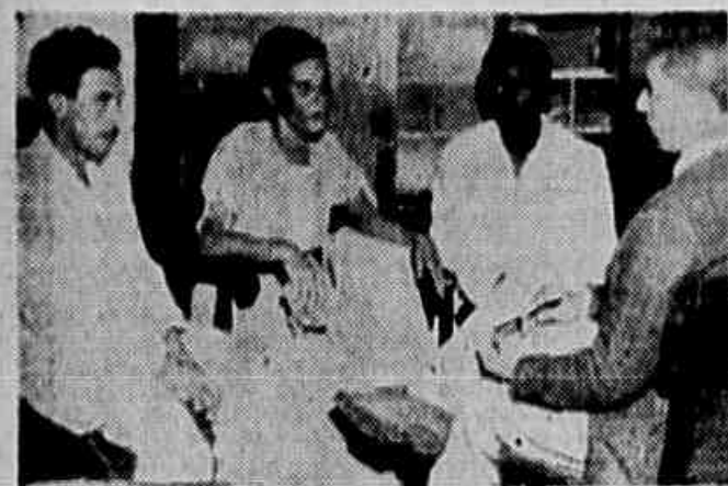
Os três camponeses expulsos da Colônia Agrícola de Xerém quando, em nossa redação, contavam as perseguições sofridas