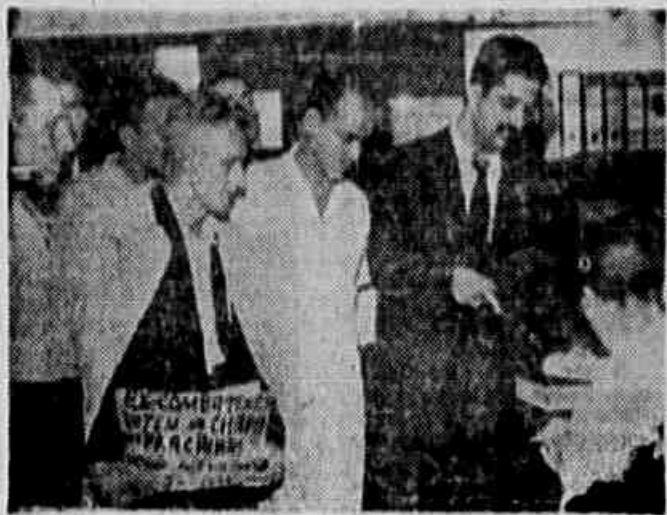
Numerosa comissao de ex-combatentes visitou nossa redacao a noite de ontem para conculmar suas tarefas e a sufragarem a "Chapa dos Pracinhas" nas eleicoes de hoje na Associao dos Ex-Combatentes do Brasil, para renovacao da sua diretorio