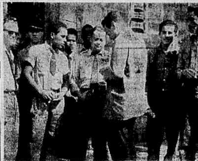
Rodovidrios da "Brasão Lisboa" quando falavam à nossa reportagem sobre suas reivindicações, manifestaram seu apoio à anistia e ao grande comício do próximo dia 9, na Esplanada do Castelo

A volta desses trens se verificará às 23,30 horas, com saída da Estação D. Pedro II.