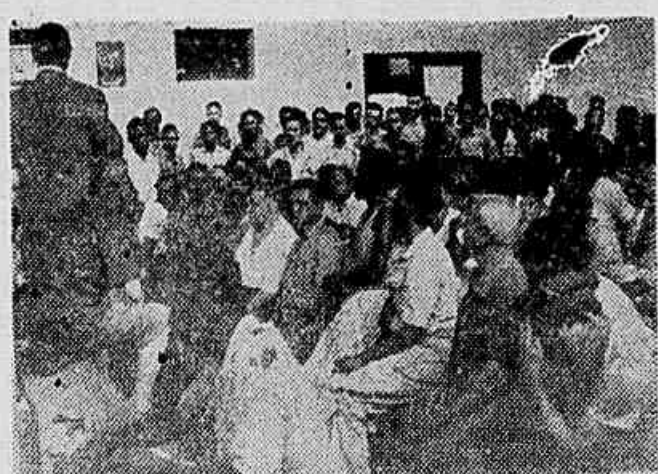
Aspecto da palestra, pronunciada, no interior da Metalúrgica Marvin, sobre a Conferência Municipal dos Metalúrgicos

Importante Palestra, no Refeitório da Empresa, Sobre o Conclave Municipal Dos Metalúrgicos — Debate Sobre os Diversos Assuntos do Temário — O Conclave Defenderá Também a Indústria Nacional Ameaçada Pela Concorrência Dos Trustes Ianques