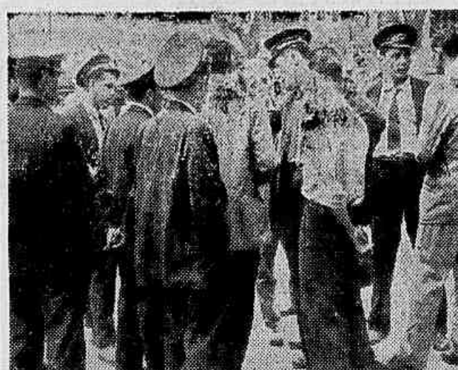
Na 5ª seção, Largo do Machado, trabalhadores da Light falando à nossa reportagem. «Somos pela anistia ampla e irrestrita e estaremos sem falta no grande comício do dia 9»