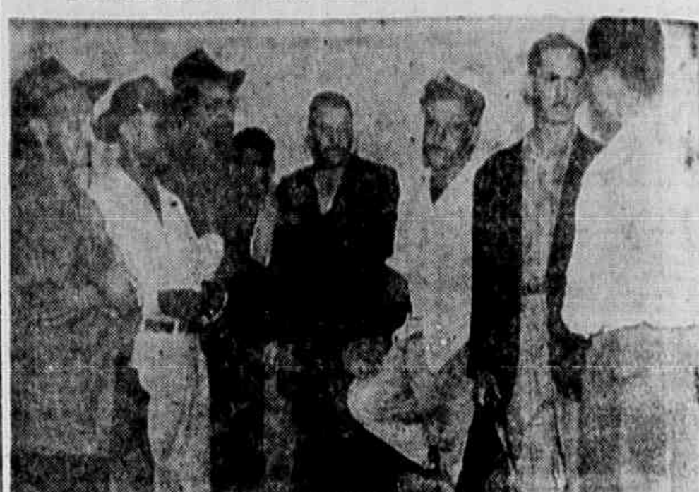
Na campanha que empolga todo o país, pela anistia ampla e irrestrita de todos os presos e perseguidos políticos, o povo toma, de instante a instante, novas iniciativas. Aqui é um ato público, ali um comício relâmpago, mais adiante uma faxa, um mural, uma inscrição. Os textos da Bonfim-Mavilla, que aparecem na foto falando ao repórter, estão se organizando em grupos de quatro, para enviar telegramas a diferentes deputados, pedindo que votem pela anistia ampla e irrestrita. É mais uma boa iniciativa, um exemplo a ser seguido.