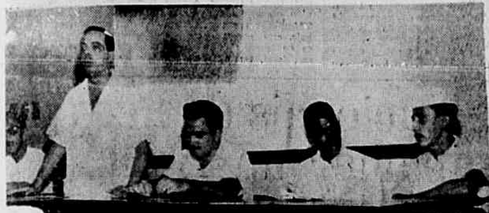
Flagrante parcial da assembléia dos servidores de obras e da verba 3

Grande Descontentamento em Diversos Setores Com os Vetos Parciais — Assembléia Dos Servidores de Obras e da Verba 3 Convocada Para Hoje, às 17 Horas