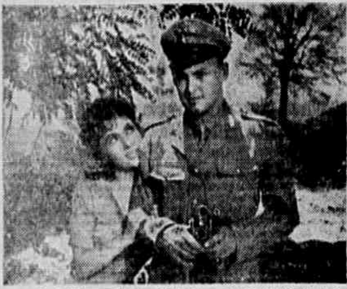
O tímido carabineiro Stelli e a esfarrapada "berroglia", que, como acima, conquistaram a simpatia do público em "Pao, Amor e Ciome" que continua em cartaz, com sua graça e brejeirice.