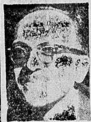
DEP. FROTA MOREIRA

1 — Um acordo sobre o desarmamento trará a confiança entre as nações, tornará caducos os tratados lesivos aos interesses nacionais como o Acordo Militar e o Acordo Atômico com os Estados Unidos.