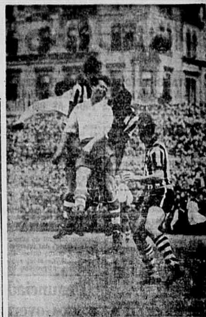
Fase do jogo Botafogo x Dinamo, vencido pelo alvi-negro por 1x0, no Estádio Nacional de Praga

Domingo próximo haverá mais uma apuração do concurso para «rainha» e «princesas» daquele conjunto residencial. O certame faz par-