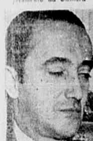
Vereador Alvaro Dias, líder do governo no Legislativo da cidade