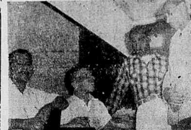
Favelados da João Cândido quando faziam, em nossa redação, o apelo