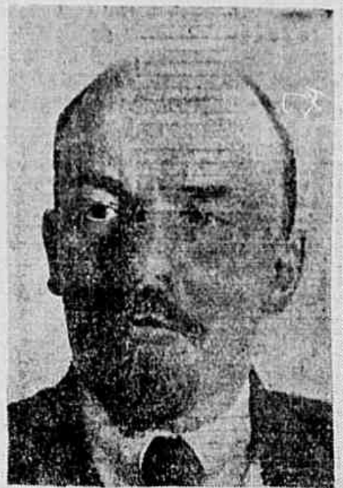
VLADIMIR ILITCH LENIN