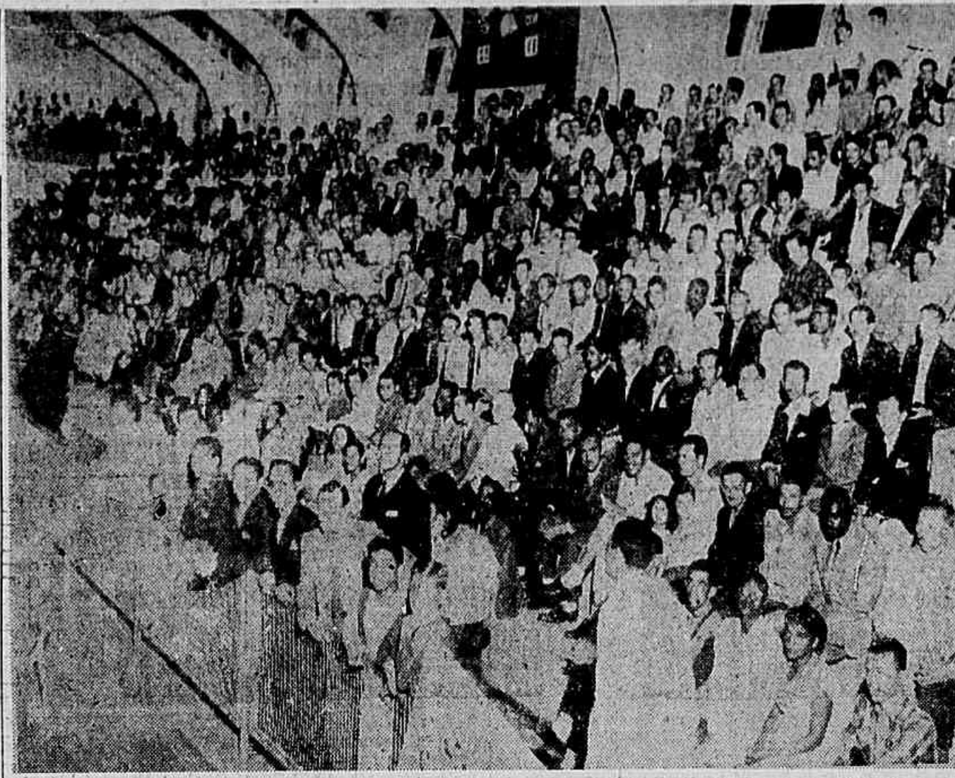
Enorme multidão de trabalhadores tomou parte na grandiosa Conferência Nacional dos Metalúrgicos, que se encerra vitoriosamente. No clichê acima, vemos um aspecto da solenidade de instalação: o ginásio da Companhia Siderúrgica Nacional inteiramente lotado.

No ato de lançamento da Quinzena a Comissão Executiva apresentará a programação que elaborou para a campanha que se prolongará do dia 2 ao dia 17 de maio, quando será encerrada com um grandioso comício na Esplanada do Castelo. Para o ato de instalação da Quinzena a Comissão Nacional Pela Anistia convida todo o povo.