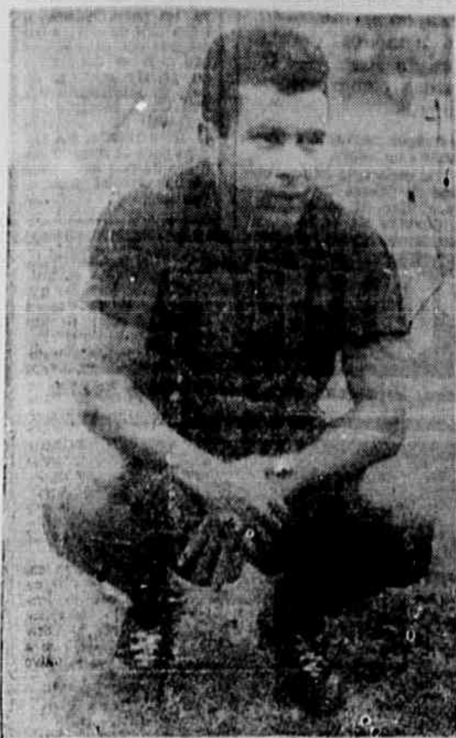
Babá, que teve destacada atuação no amistoso de anteontem em Campos quando o Flamengo se impôs ao América por 6x2, deverá enfrentar o América mineiro hoje