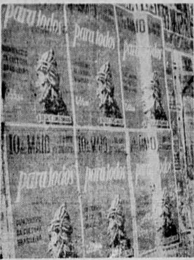
Lançamento de «Para Todos»

Comemorando o lançamento do quinquênio de cultura "Para Todos", realizou-se hoje, a partir das 22 horas, uma festa no Clube Marimbá (junto ao Forte de Copacabana). "Para Todos" reaparece sob a direção de Jorge Amado e reúne entre os seus colaboradores numerosos nomes de prestígio no mundo das letras e das artes, tais como Oscar Niemeyer, Alvaro Moreyra, Fernando de Azevedo, Sérgio Millet, Marques Rebelo, Mário Mendes, Vinícius de Moraes, Origens Lessa, Di Cavalcanti, Barão de Itararé, Ary Barroso, Mário Barata, Astrogildo Pereira e outros.