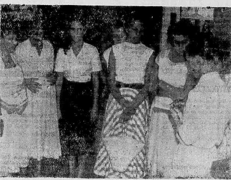
ESTEVE em nossa redação uma comissão de senhoras moradoras em Niterói, São Cristóvão e Leopoldina para protestar contra o regulamento imposto na Câmara Federal. Declararam que as pessoas ao entrar são revistas e ainda, só é permitida a permanência de pessoas no 5.º andar, o que obriga mulheres velhas e crianças a subir a escadaria. Esta comissão veio também fazer um apelo a todos os patriotas para que compareçam em massa na Câmara para apoiar os deputados a fim de que a campanha pela anistia seja vitoriosa em todos os sentidos.