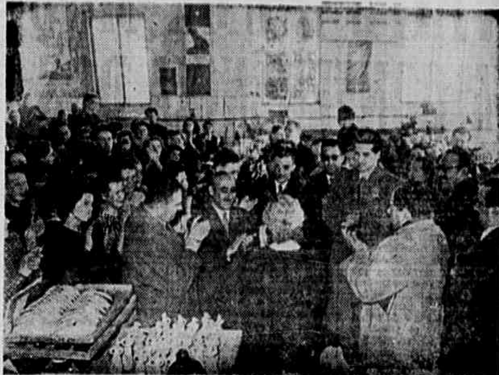
EM LENINGRADO, um grupo de delegados latino-americanos que tomaram parte na sessão extraordinária do Conselho Mundial da Paz realizado em Estocolmo, visita a Fábrica de Porcelanas «Lomonossov».