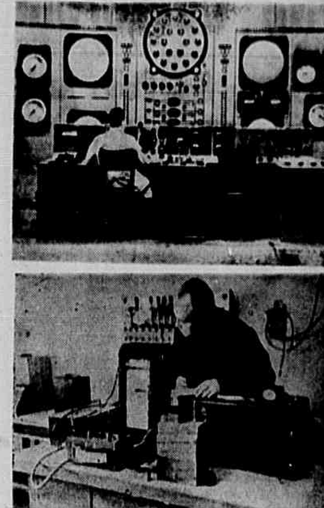
Laboratórios para estudo da energia atômica na U.R.S.S.

O funcionamento do formidável sincrociclotron constituirá um importante acontecimento da ciência e da técnica soviética. Utilizando essa instalação, os homens de ciência soviéticos poderão resolver difíceis problemas teóricos de importância primordial para o emprego da energia atômica com fins pacíficos.