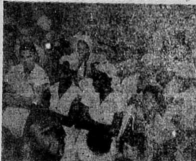
As operárias da Fábrica Bhering, durante palestra ontem realizada, na hora do almoço, elegeram uma delegação à Conferência Nacional dos Trabalhadores, que se instalará no próximo dia 18. No comitê de representação, oficialmente, o Sindicato dos Trabalhadores em Panificação, Bolo, Produtos de Café e Cacaú. (Leia reportagem na sexta página)