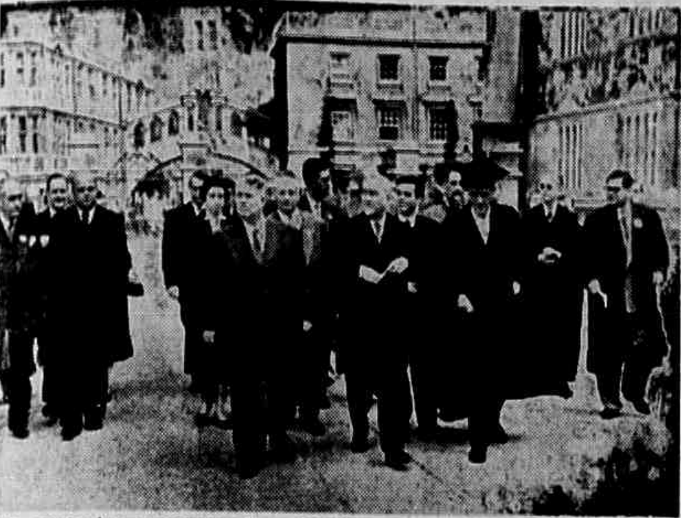
Na recente viagem que empreenderam à Grã-Bretanha, os dirigentes soviéticos N. A. Bulgânin e N. S. Kruschiov foram homenageados com um amplo programa de visitas a diversos estabelecimentos culturais do país, inclusive a famosa Universidade de Oxford. Na foto, os altos membros do governo da URSS quando percorriam as dependências da célebre universidade

Transferida a votação em virtude de não ter ficado pronta a redação final do projeto Vieira de Melo — O povo carioca continua acorrendo em massa ao Palácio Tiradentes — Providências da Mesa para a imediata votação da urgência