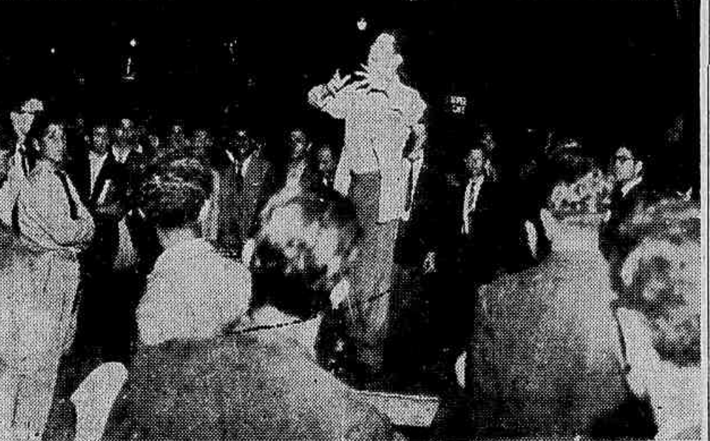
Os universitários brasileiros têm tido destacada participação na campanha pela pacificação da família brasileira. A anistia, por de cima do Conselho da U.N.E., de São Paulo será discutida em todas as faculdades do Estado. Em numerosos estabelecimentos de ensino superior, estão sendo coletadas assinaturas em prol da anistia e diversos jornais dedicaram edições especiais ao assunto. Outra iniciativa dos acadêmicos de São Paulo é a realização de comícios nos pontos de maior concentração popular. Na foto, um comício-relâmpago promovido por universitários, na Praça da Sé

Promovido pela União Metropolitana de Estudantes terá a participação dos deputados Vieira de Melo, Adauto Cardoso, Sérgio Magalhães e Rogê Ferreira — (Texto na segunda pág.)