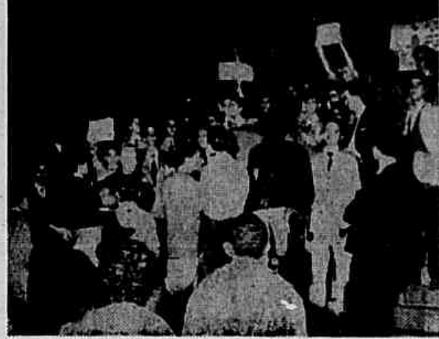
No próximo dia 15 os estudantes farão novo comício contra o golpe da Light