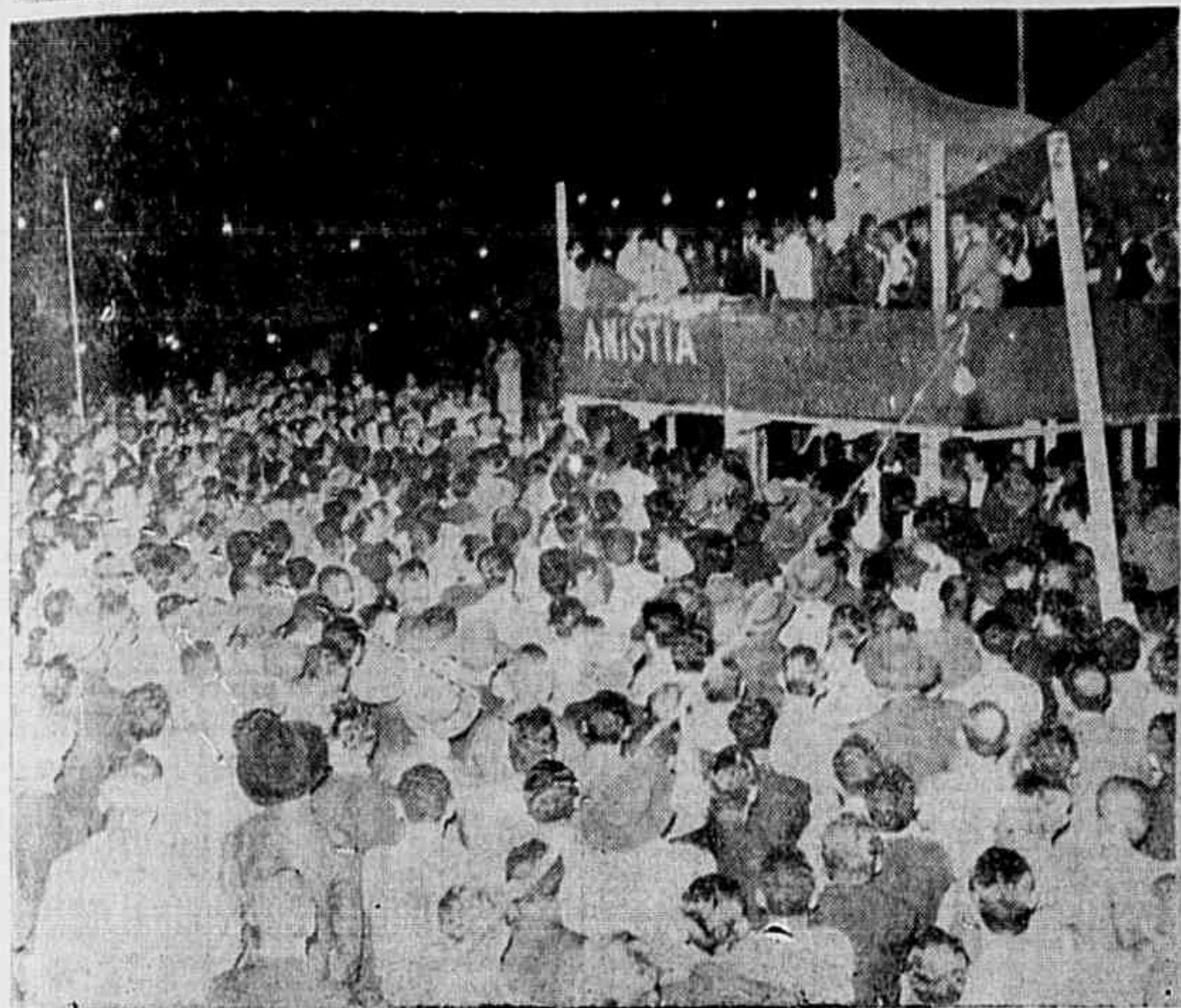
Dois ilagantes do grande comício.