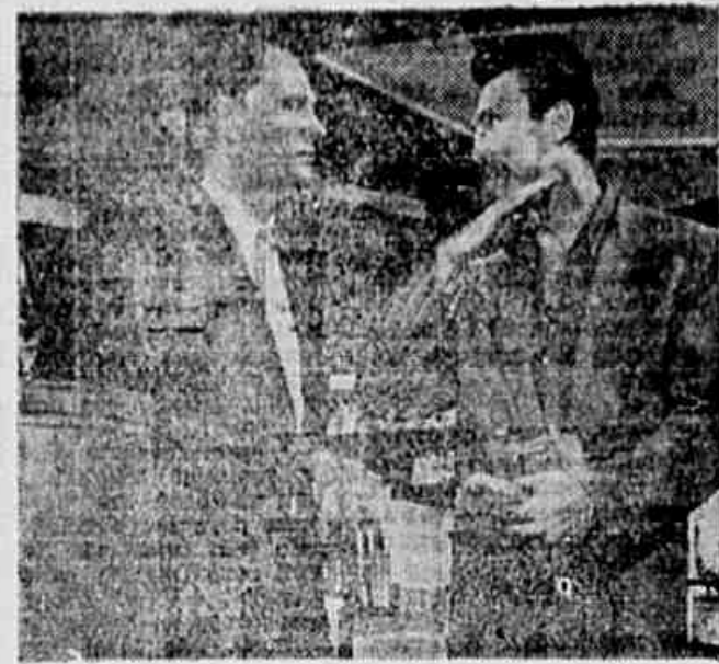
Vemos na foto Wendell Corey e Jack Palance intérpretes de A Grande Chantagem, um retrato não muito simpático dos bastidores de Hollywood.