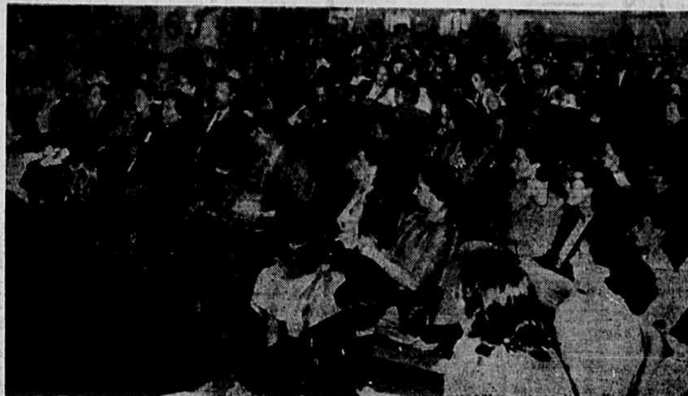
Duzentas e sessenta e uma delegadas participaram da 1ª Conferência Nacional de Trabalhadoras debatendo os problemas de 17 milhões de mulheres brasileiras que têm os seus direitos espoliados, mesmo aqueles que estão inscritos na Constituição da República. Na foto um aspecto da Conferência