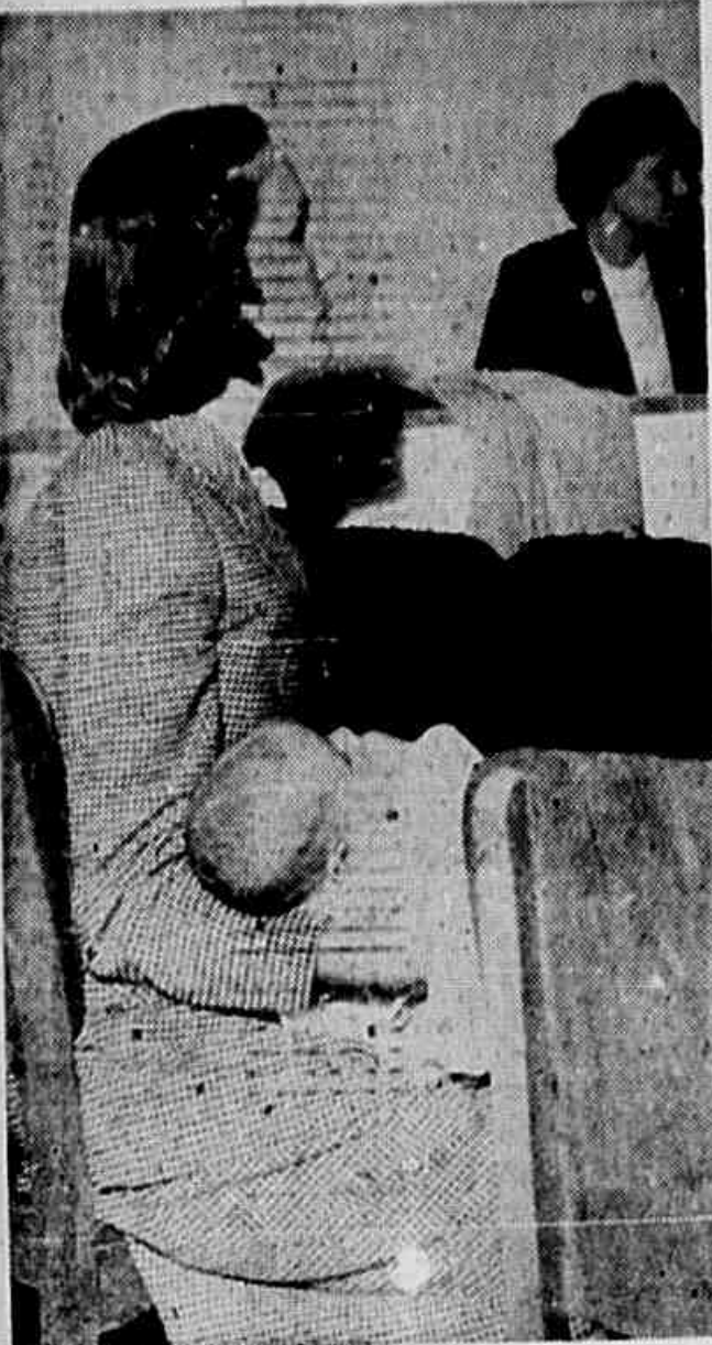
Algumas deixaram os filhos em casa, vindas de distantes regiões. Uma delegada adoeceu porque deixara o filho em período de amamentação, há mais de uma semana. Mas foi pelos próprios filhos, por seu futuro que por tudo isso passaram. Outras trouxeram os filhos e com eles ao colo é que assistiam e participavam das discussões, como se fossem elas a razão de sua presença ali na Conferência

A Conferência Nacional de Trabalhadoras, ao tomar estas resoluções, está certa de que expressa as mais justas reivindicações das trabalhadoras e que unidas e organizadas em suas associações e sindicatos, conquistarão uma vida mais feliz e mais justa para si e seus filhos.»