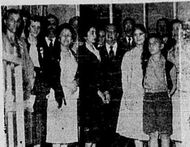
Os diretores do Cassino Bangu que aparecem na foto, receberam uma recepção das delegadas à Conferência, com trocas de "corbilles" e flâmulas

às possibilidades. Mesmo assim, daí se extrai uma grande experiência: onde é maior o número de sindicalizadas, de trabalhadoras organizadas, as condições de trabalho e de vida são menos difíceis. Organizadas, as trabalhadoras empreendem com êxito suas lutas reivindicatórias.