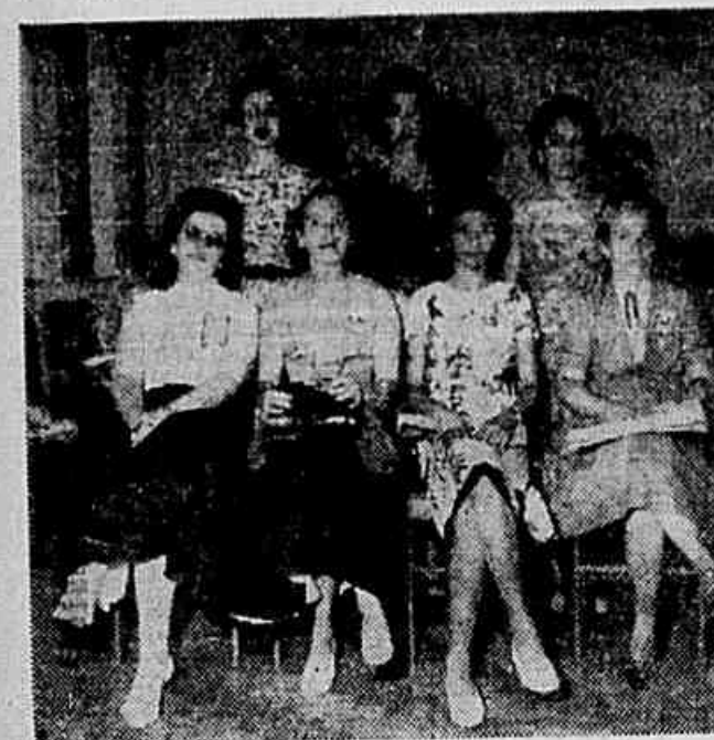
A delegação das trabalhadoras de Minas Gerais, integrada por representantes de Belo Horizonte, Juiz de Fora, Cataguazes e Conselheiro Lafayete