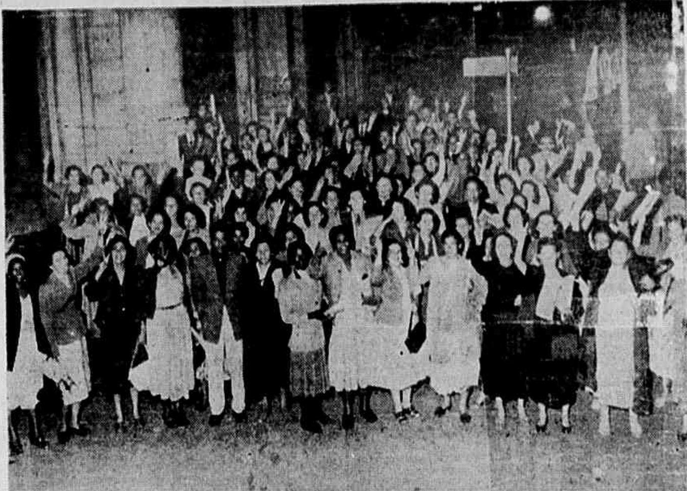
"Conferência Nacional de Trabalhadoras; nossos direitos vamos conquistar. Para o Brasil, para o Brasil, um dia melhorará..." Na passarela desde a Esplanada do Castelo até a confluência das Avenidas Rio Branco e Presidente Vargas, nasceu o "Hino da Conferência". Na foto, um flagrante colhido durante a entusiástica passeata

Os fatos mostram que a mulher trabalhadora luta — em todos os pontos do país — toda vez