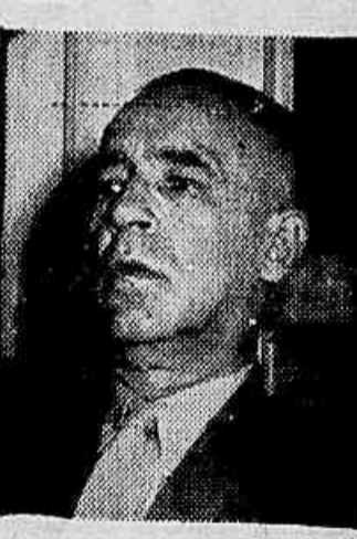
General Saturnino Lange

tores e sócios dos diversos Núcleos cariocas à Assembléia Geral do dia 22 do corrente; b) recomendar a todos os Núcleos a participação no Congresso Nacional de Defesa dos Minérios; c) convocar nova reunião para a próxima sexta-feira, dia 25 do corrente, às 18h30m, quando os Núcleos cariocas deverão apresentar, por escrito, um relatório das suas atividades e dos problemas de seus bairros e um plano de trabalho.