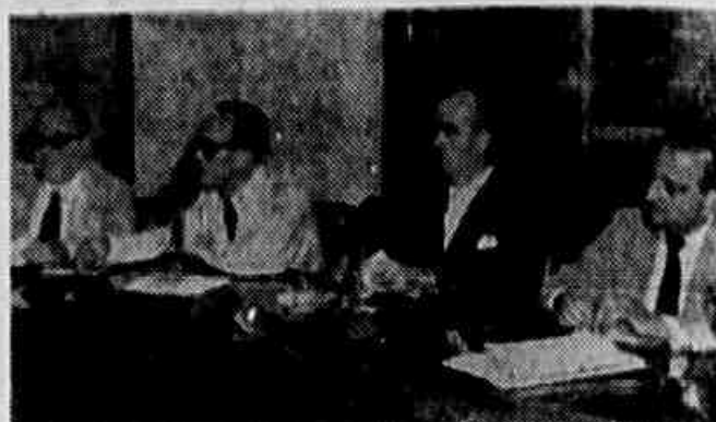
A bancada dos artistas da COFAP que luta encarnadamente pelo aumento dos ingressos dos cinemas