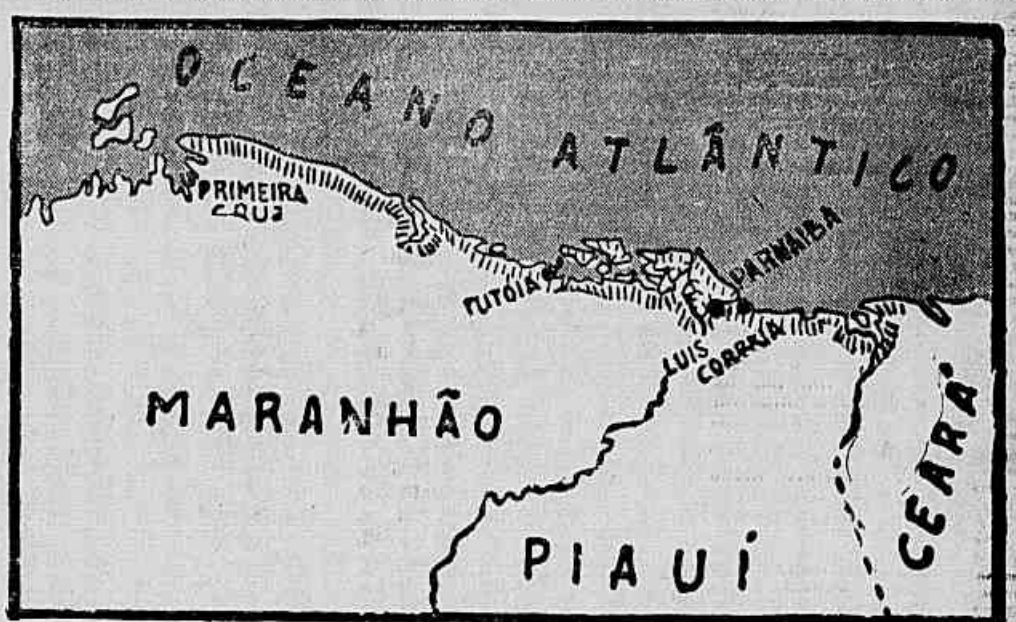
Costa do Nordeste ocidental, vendo-se, assinalado, o trecho já pesquisado pelos agentes dos trustes norte-americanos