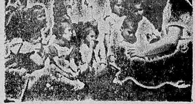
A libertação da Rumânia do jug fascista e da dominação capitalista, trouxe uma vida nova, muito melhor e mais feliz, para o povo rumeno — para os operários e camponeses, principalmente. É para eles que o governo da República da Rumânia volta, sua maior atenção. As fotos são bem uma mostra disso. Na primeira, vemos filhos de trabalhadores do Combinado Plástico Casa de Scanteni em uma colônia de férias. Na outra foto, algumas casas das repúblicas coletivistas de fazendas da região de Banat.