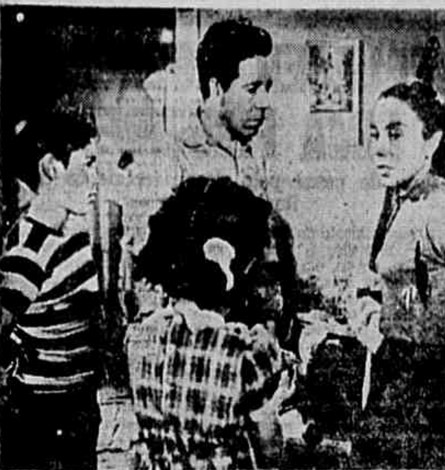
Na foto, cena do filme O Sal da Terra, premiado na VIII Mostra de Karlovy Vary, sendo-se à direita a atriz Rosaura Revueltas