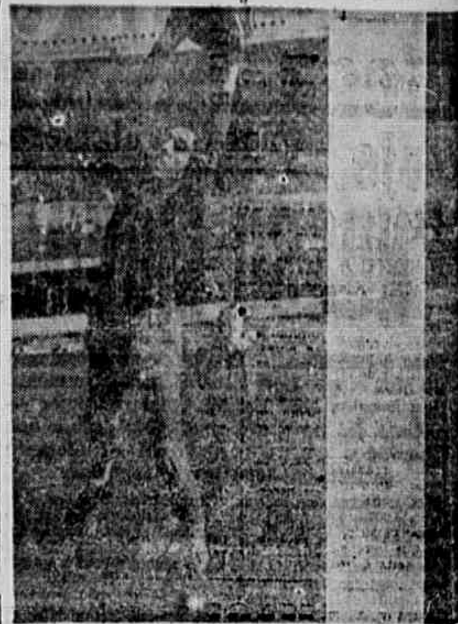
"Cabeção está machucando muito", diz o médico

A equipe que reúne muitas possibilidades de ser a titular e a seguinte: Nandinho; Djalma Santos e Elson; Zizinho, Osvaldinho e Hélio; Canário, Zizinho, Leonidas, Hilton e Ferreira.