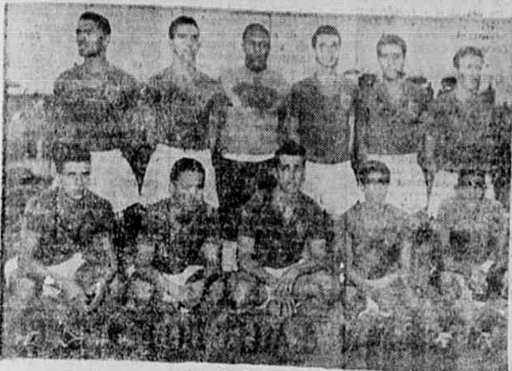
A equipe do Bonsucesso

AMANHÃ, AS 15,30 HORAS, EM 8. JANUÁRIO — DOMINGO, O EMBARQUE PARA ASSUNÇÃO — HOJE, O APRONTO DOS RUBRO-ANIS