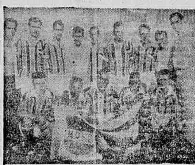
Equipe do DND, que vem sustentando galhardamente a liderança invicta do campeonato entre fábricas de calçados