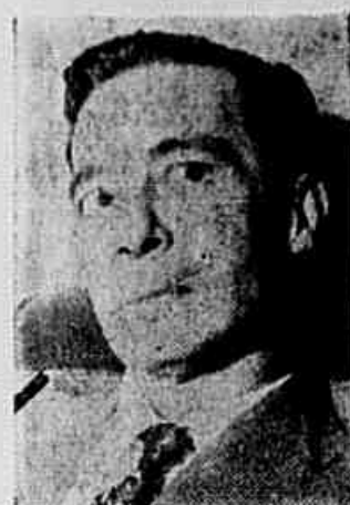
Senador Moura Andrade

Depois de visitar oficialmente, em companhia de outros parlamentares, vários países do campo do socialismo, como a Tchecoslová-