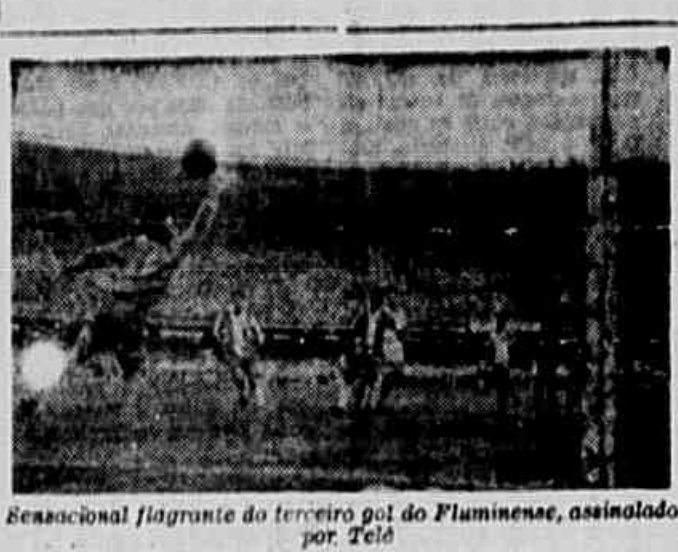
Sensacional flagrante do terceiro gol do Fluminense, assinalado por Telê

Requisitados novos jogadores e mantida a seleção vencedora dos paraguaios — Dispensados alguns jogadores do América para enfrentar o Racing