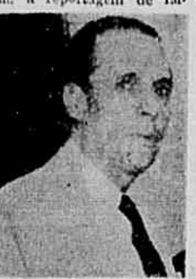
O presidente do Sindicato dos Hoteleiros

— As demarções da luta pelo aumento de salário em defesa até agora sem uma definição pois, como é sabido, nenhum acordo foi conseguido com os empregados na primeira audiência de conciliação — declarou, ontem, a reportagem de IM-