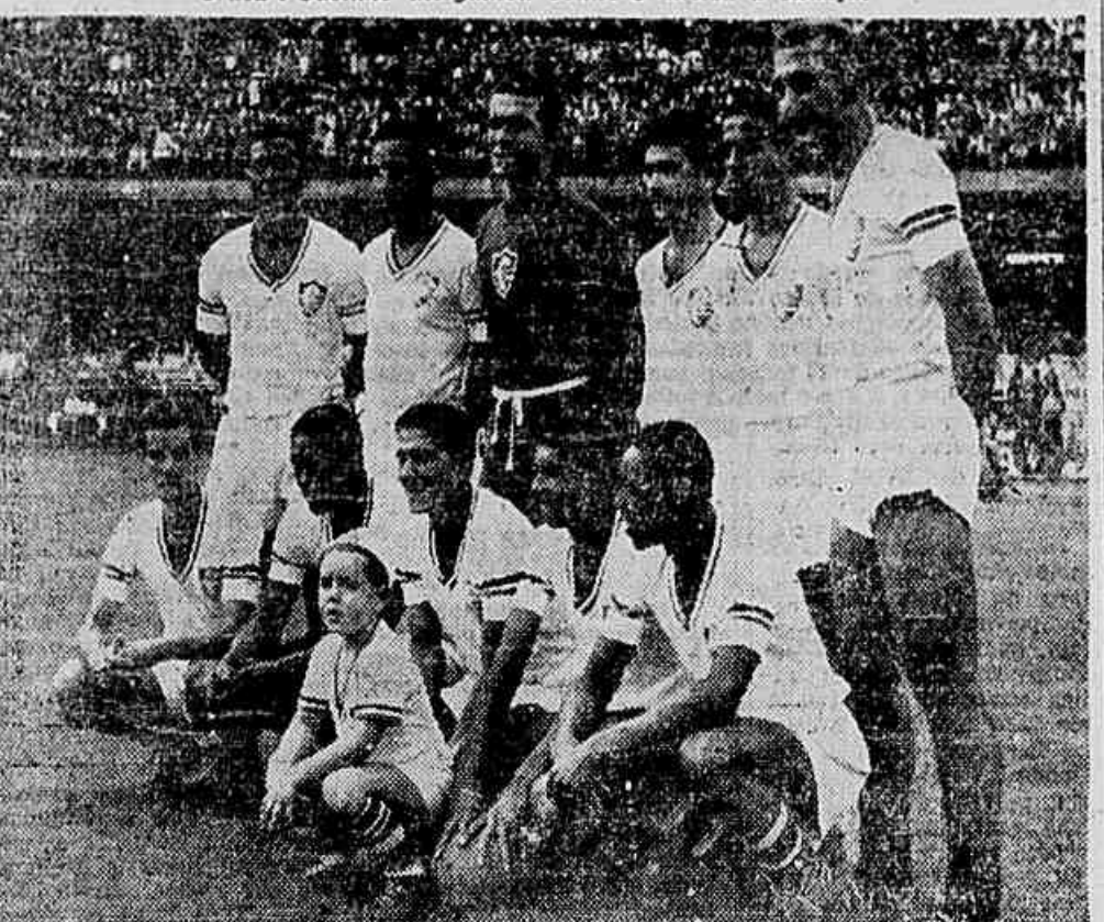
Na foto, a equipe tricolor vencedora do Pôrto.