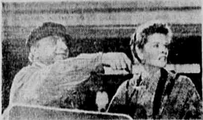
Das seis filmes em cartaz esta semana um merece a nossa indicação: a película de um filme bonito e bem realizado, trata-se de QUANDO FLORESCE O CORAÇÃO que agrada aos amantes do bom cinema.