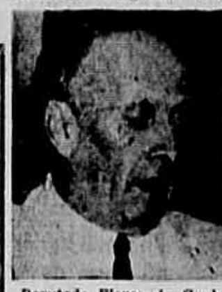
Deputado Flores da Cunha Deputado Tenório Cavalcanti

ANO IX ★ RIO DE JANEIRO, SEXTA-FEIRA, 29 DE JUNHO DE 1956 ★ N.º 1.848