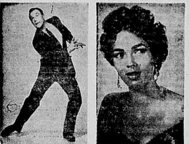
GENE KELLY DOROTHY DANDRIDGE