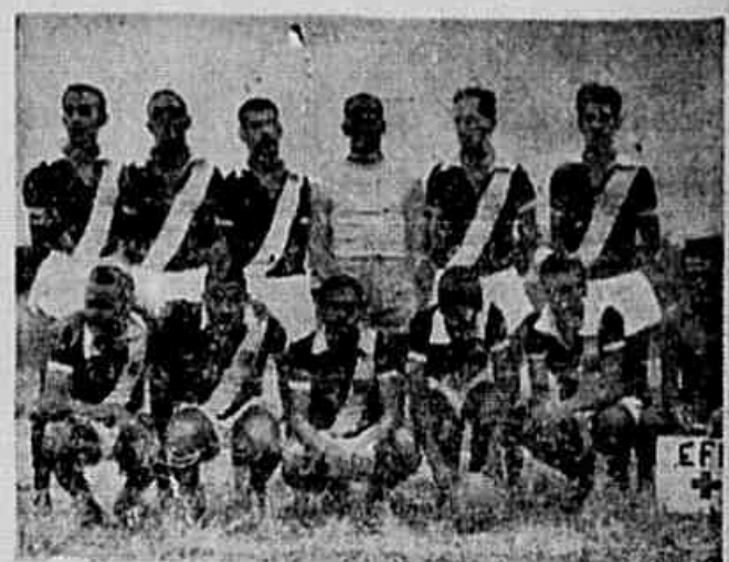
A representação do Expressinho que foi goleada pela Barra da Tijuca

— OoO — Está marcado para amanhã o embarque do Flamengo para Lima, afim de cumprir alguns compromissos naquela Capital.