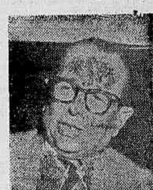
Sen. Kerginaldo Cavalcanti

Proseguindo, o parlamentar pelo Rio Grande do Norte a-sinalou que os agentes do capitalismo internacional têm sempre ao seu lado a polícia-política, a força das armas, para sufocar as protestos populares. E concluiu