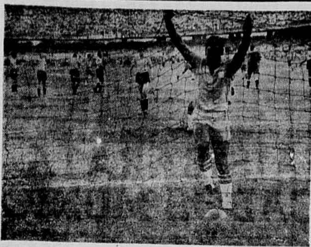
Leônidas, desta feita, não teve a satisfação de buscar a pelota no fundo das redes. Mas deu um balaço na trave que espantou os argentinos

No segundo tempo, ambas as equipes realizaram trocas de jogadores. O ponteiro esquerdo brasileiro Ferreira foi substituído por Pepe, enquanto o zagueiro argentino Dominguez foi substituído por Pepe.